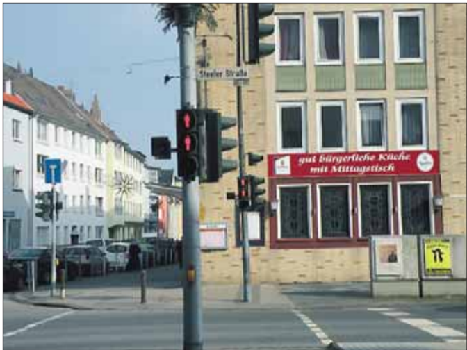
Eine bekannte Adresse, das Kolpinghaus an der Karl-Meyer-/Ecker Steeler Straße in Rotthausen. www.restaurant-kolpinghaus-rotthausen.de