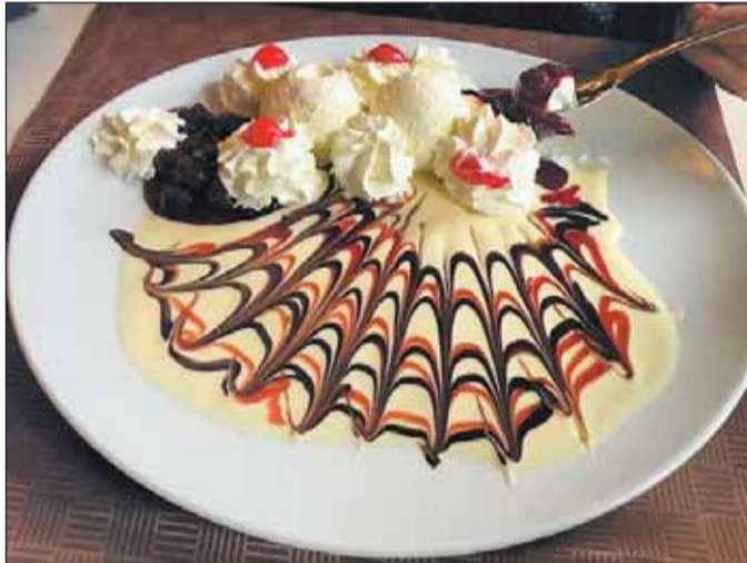
Eigene Dessertkreationen als Krönung eines guten Essens.