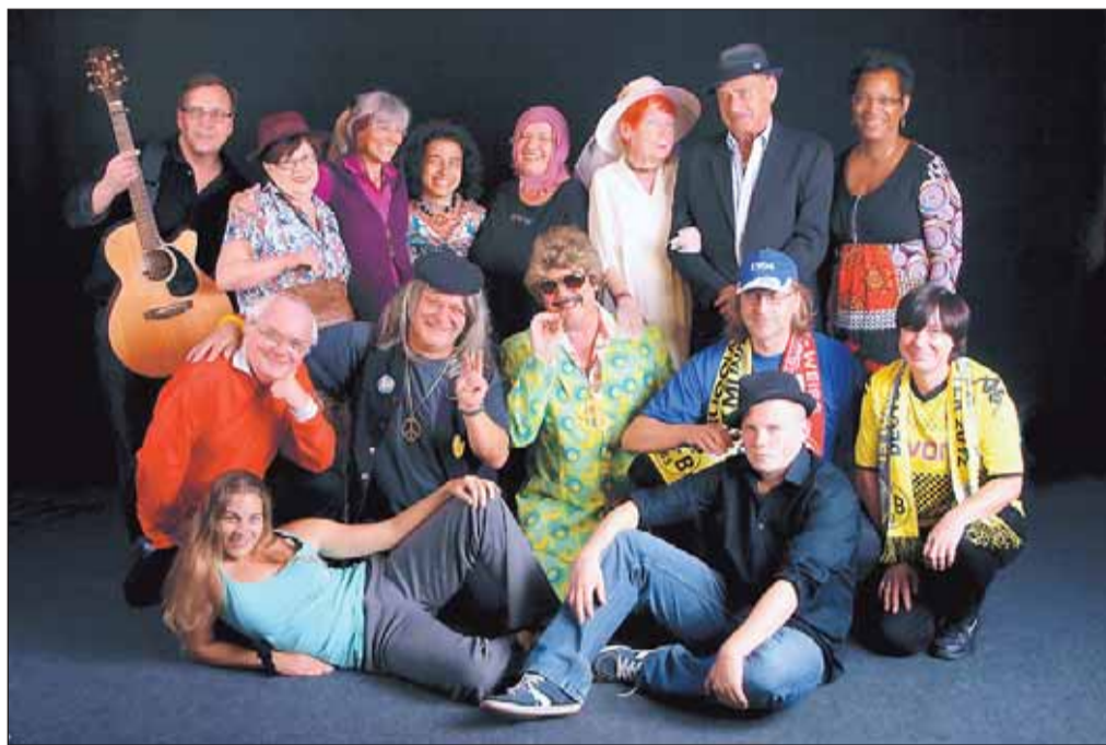
Das Altenessener „Ruhr-Theater“ mit seinem gut 35köpfigen, ehrenamtlichen Ensemble will es bald wieder kräftig krachen lassen. . Schräge Typen, neue Songs und Choreographien, neue Spielszenen in spektakulären Szenarien machen Vorfreude auf ein buntes Spektakel. Tickets und Termine s. Bericht.