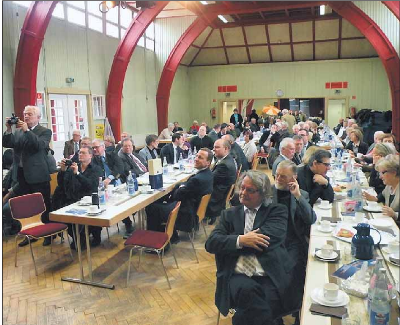
Unser Bild erinnert an den Neujahrsempfang der CDU Zollverein im Januar 2012 in der Jugendhalle Schonnebeck.