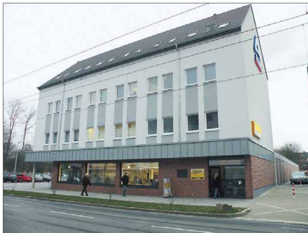
Eine Straße verändert ihr Gesicht. Von der Allgemeinheit positiv bewertet wird das neue Geschäfts- und Ärztehaus, Katernberger Straße 48.

Die Erreichbarkeit ist für eine orthopädische Praxis ein ganz besonders wichtiger Aspekt. Wer mit dem Auto anreist, findet im Umfeld zahlreiche Parkmöglichkeiten. Die Anbindung an den öffentlichen Nahverkehr ist geradezu ideal. Busse (Linien 170 und 183) und Straßenbahn (Linie 107) halten direkt am Katernberger Markt, also nur ein paar Schritte vom Haus Nr. 48 entfernt. - WiZi -