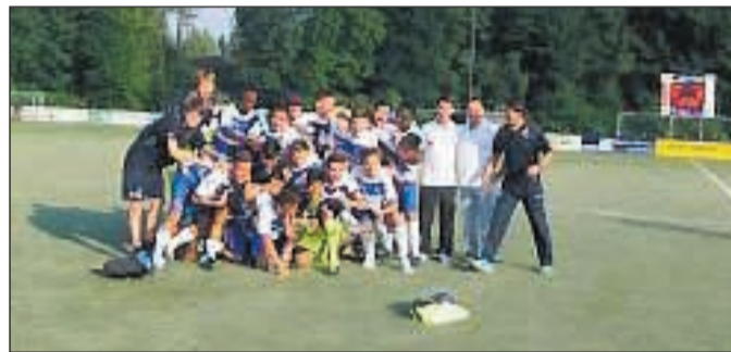
HUK U 19 Cup, eine fröhliche Begegnung.

Gruppe jeweils mit 3:0 gegen Schonnebeck und den Wuppertaler SV durchsetzte und so locker den Einzug ins Halbfinale schaffte - dort aber am späteren Sieger Duisburg denkbar knapp scheiterten. Das Elfmeterschießen musste sogar in die Verlängerung, bevor Duisburg sich mit 8:7 durchsetzen konnte. Ein Elfmeterschießen gab es auch im zweiten Halbfinale, Eintracht Braunschweig zog dort gegen den ETB mit 3:5 den Kürzeren. Das Spiel um den dritten Platz entschied Braunschweig wieder für sich. „Wir sind zufrieden mit dem Turnier. Das Testspiel von RWE gegen den BVB hat uns leider ein paar Zuschauer gekostet, aber die Veranstaltung war trotzdem ein Erfolg. Die Chancen 2015 wieder U19-Bundesligisten am Schetters Busch begrüßen zu können, stehen gut“, zog Tobias Tenberken, Schonnebecks Organisator, ein positives Fazit.