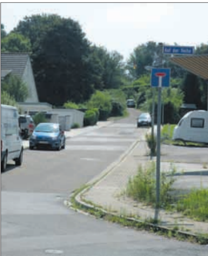
Hier geht's zum „Stadtgarten Bonnekamphöhe“.

Bonnekamphöhe befindet sich eine große Lichtung an der Stadtgrenze zu Rotthausen, zu erreichen über die Straße Auf der Reihe, gegenüber der Einmündung Bonnekampstraße. Die Initiatoren begannen bereits im Jahr 2011 mit der Nutzbarmachung dieser Fläche durch den Aufbau von Gewächshäusern, Anbauflächen und eines Bewässerungssystems. (mehr auf Seite 2)