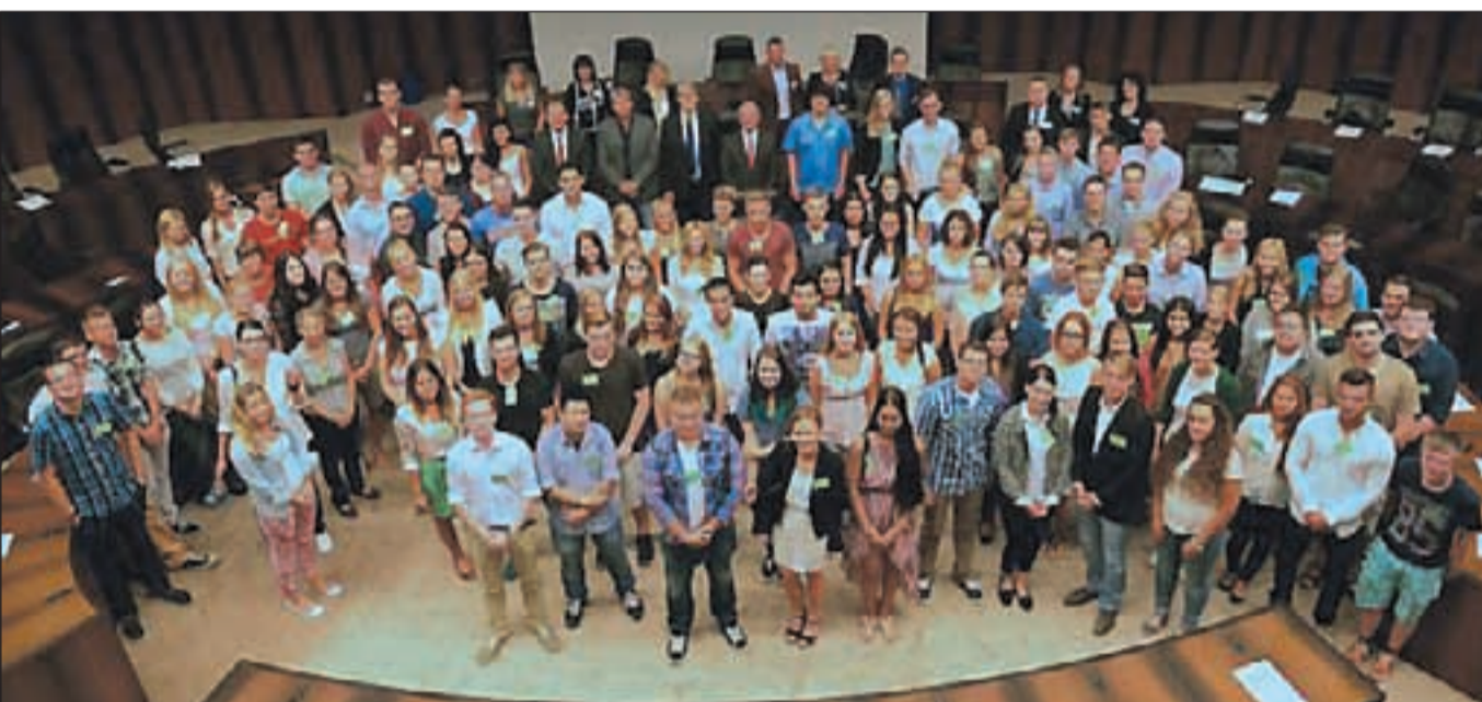
Begrüßung der neuen Auszubildenden der Stadtverwaltung Essen.