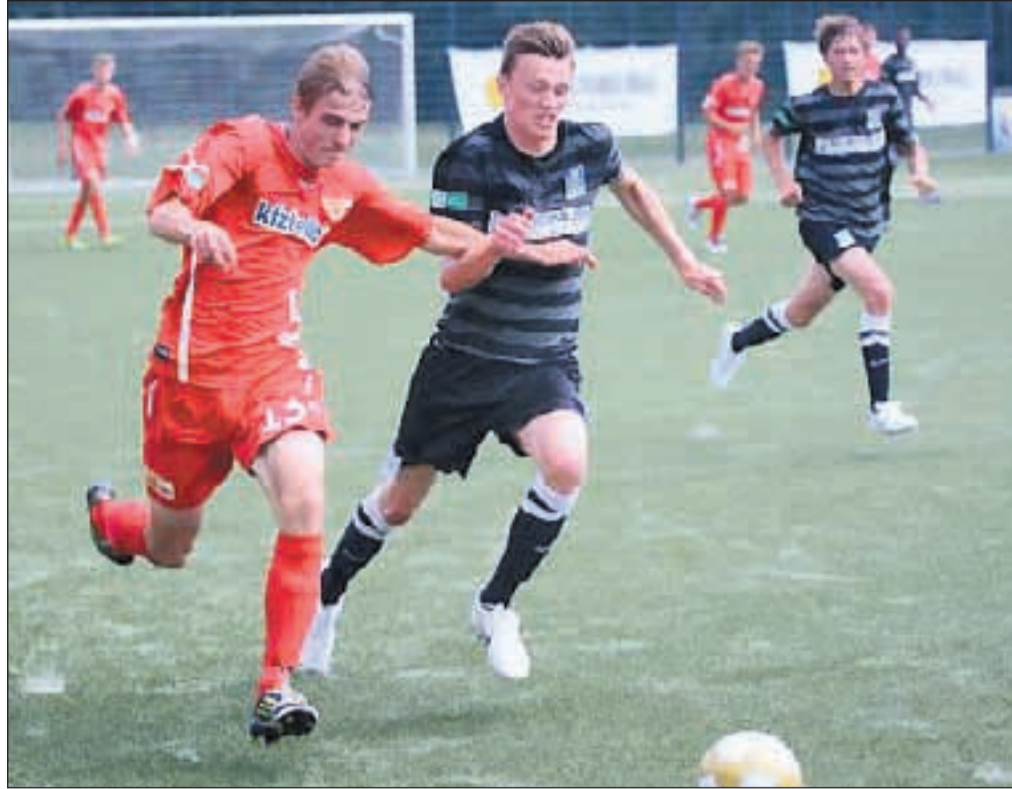
Zum ersten Mal gewann gewann der MSV Duisburg den U 19 Cup am Schetters Busch.