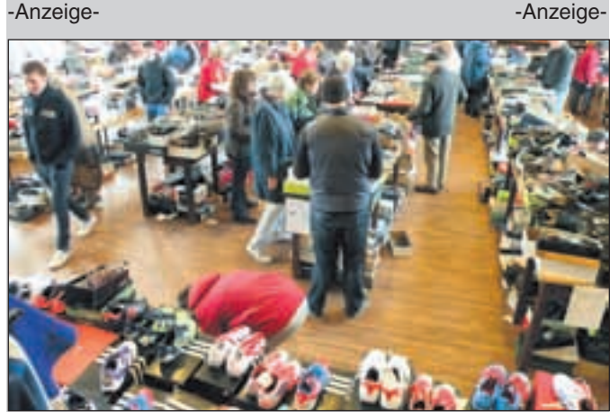
Das Kolpinghaus Rotthausen, hier ein Foto aus 2012, ist seit langem eine ausgewählt gute Adresse für den Verkauf günstiger Marken-Textilien und -Schuhe.

programm kann kostenlos angefordert werden unter: Telefon + Fax 0201 - 30 61; e-mail: arka.essen@vodafone.de, Internet: www.arkakulturwerkstatt.de.