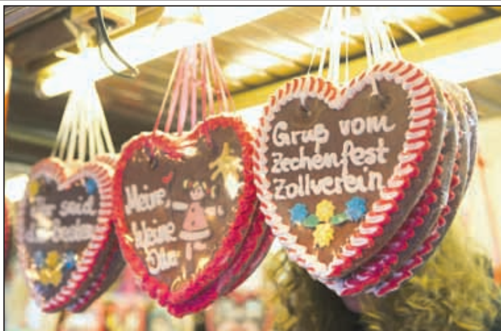
Die drei Werbegemeinschaften des Stadtbezirks VI – Zollverein und die Stiftung Zollverein laden herzlich zum 25. Großen Zechenfest ein.