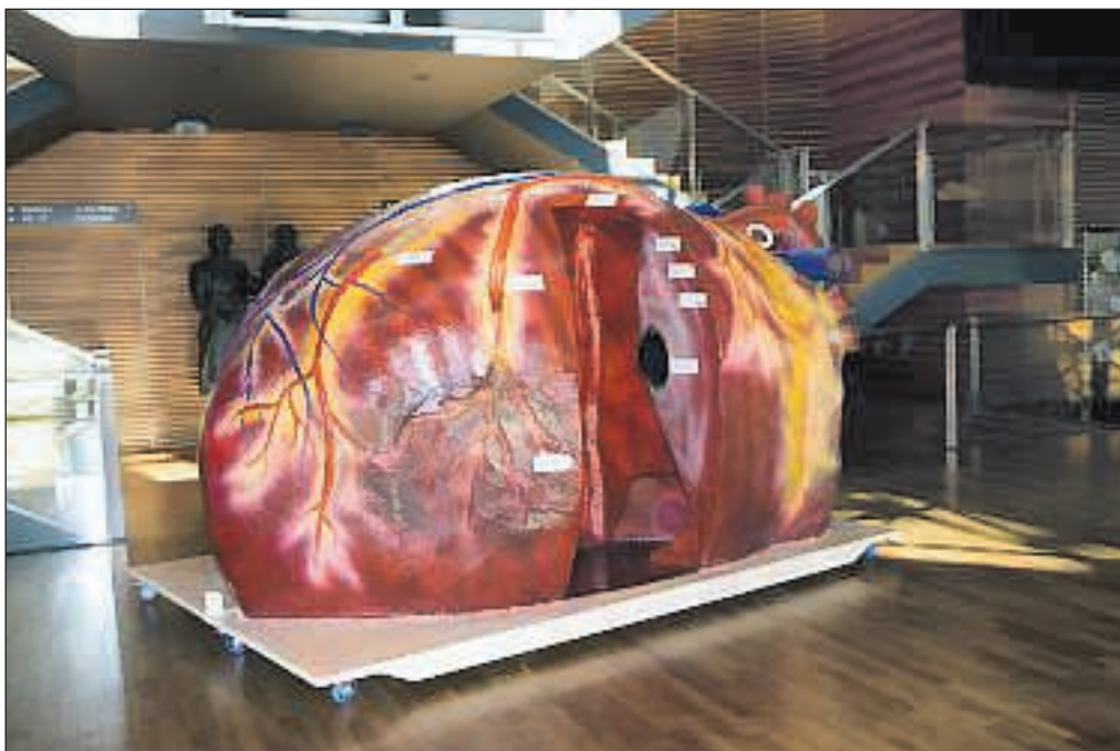
Ein Herzmodell erwartet die Zechenfestbesucher in der Halle 5.

Die Ausstellung des LVR-Industriemuseums und des Ruhr Museums in der Mischanlage der Kokerei Zollverein präsentiert die Rhein-Ruhr-Region vor, während und nach dem Ersten Weltkrieg. Eintritt: 10 Euro [ermäßigt 7 Euro, Kinder/Jugendliche bis 14 Jahre haben freien Eintritt. Wann und Wo: Samstag und Sonntag, 10.00 bis 18.00 Uhr. Ort: Areal C [Kokerei], Mischanlage [C70], Eingang: Areal A [Schacht XII], Wiegeturm [A29].