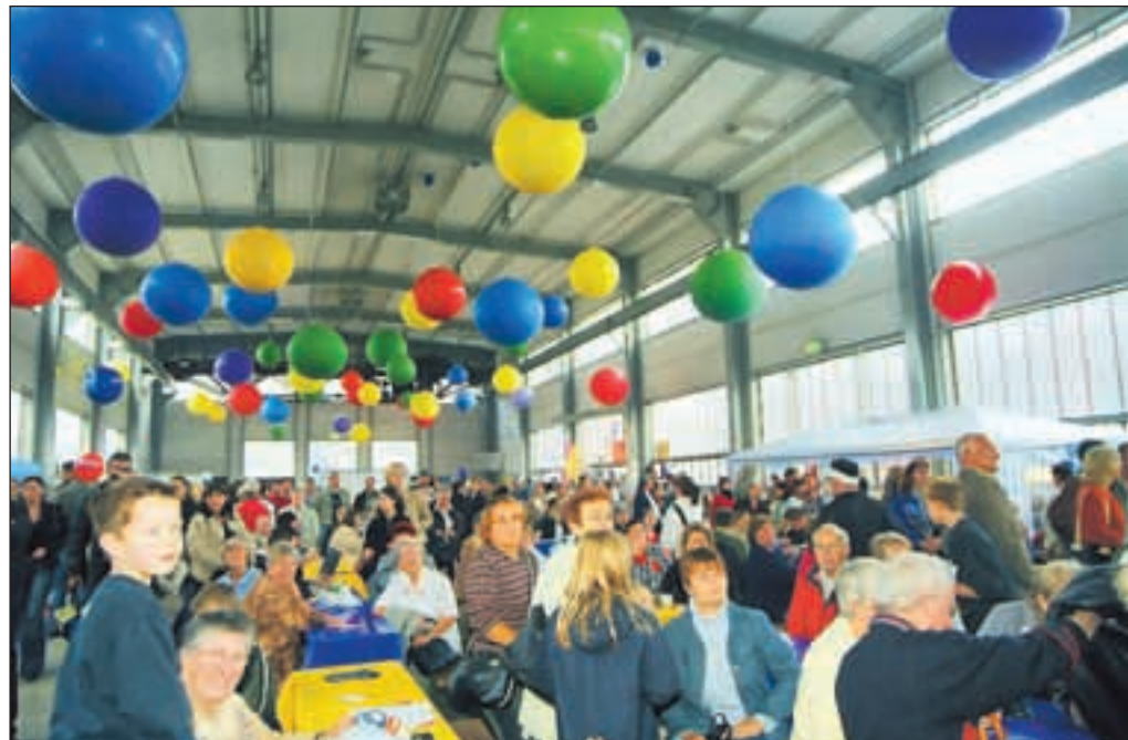
Bunt und einladend präsentierte sich schon 2004 die Halle 5, bespielt von den Werbegemeinschaften des Stadtbezirks VI.

Restaurant – Gaststätte FREIZEITHEIM Zechenfest 2014 Unser Team ist ganztägig für Sie vor Ort und verwöhnt Sie im Ehrenhof mit ..... Rindsrouladen und Sauerbraten mit Klößen und Rotkohl ➤ frischem heißen Backfisch ➤ Kibbeling Knoblauchsoße/Remoulade ➤ köstlichen Antipasti-Tellern ➤ herzhaften Bocorones ➤ diversen von Beate hausgemachten Salaten ➤ feurigem Chili con Carne ➤ Crêpes – Variationen + Kaffee ➤ Zu Beates Küchen-Highligts genießen Sie passende Weine, prickelnden Sekt – Prosecco, Pils und Alt vom Fass Unsere Gaststätte bleibt am 27. und 28.9. geschlossen. Wir starten am 5. Oktober mit dem Oktoberbrunch in die Bayrische Woche . Oktoberfest im Freizeitheim am 10.10. mit Musi, Gaudi und bayrischen Schmankerln Reservierungen Tel. 293 92 95