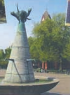
Wasserturm in Frillendorf