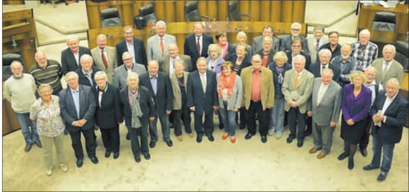
Geballte Kompetenz in sozialen Angelegenheiten – der Seniorenbeirat vor der konstituierenden Sitzung am 15. Oktober im Rathaus Essen.