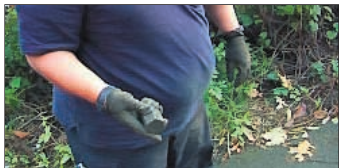
Die Bombe sieht harmlos aus, war aber einst ein höchst gefährliches Kampfmittel..