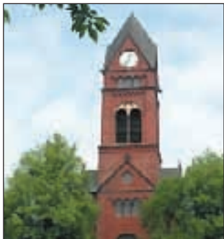
Der Bergmannsdom am Katernberger Markt.