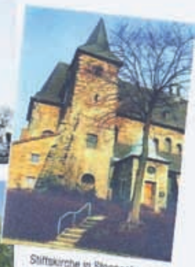
Stiftskirche in Stoppenberg