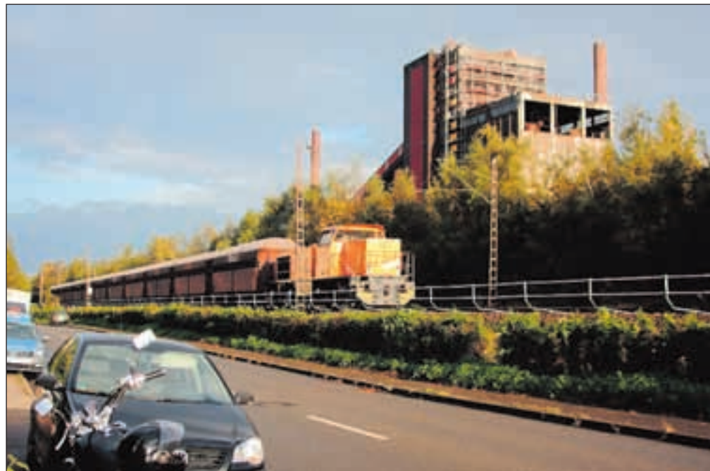
Die Bahnlinie an der Köln-Mindener-Straße wurde am 8. Oktober wegen eines Bombenfundes vorübergehend stillgelegt.