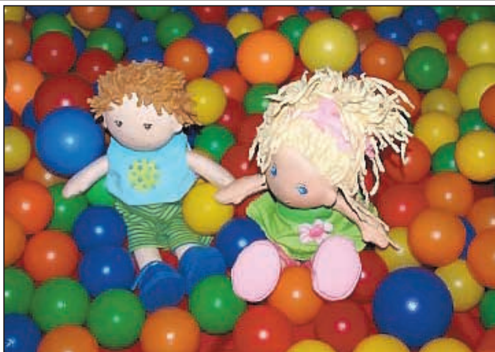
Bunt und fröhlich soll es auch in dieser Winterspielplatzsaison der Christuskirche zugehen.