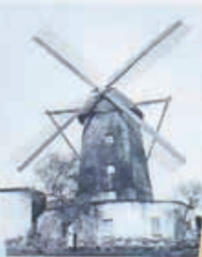
Ehem. Mühle in Schonnebeck