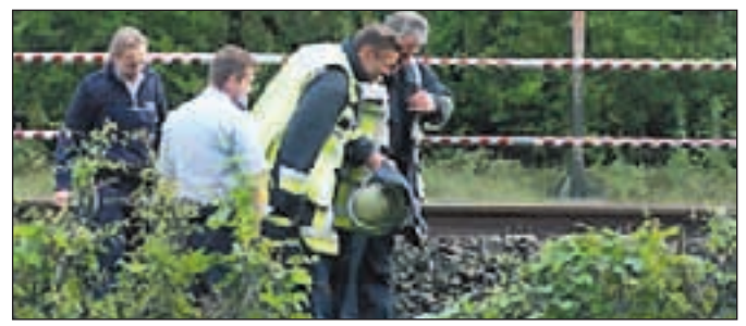
Vorsichtiges Nähern der Einsatzkräfte.

sicht an der Stelle vorbeiziehen. Als der Kampfmittelräumdienst eingetroffen war, wurde die Bombe sichergestellt und nach Düsseldorf verbracht, wo Sie unbrauchbar gemacht wurde. Wie die Bombe dort hinkam, ist fraglich. Die Bahnpolizei hat die Ermittlungen aufgenommen. Fotos/Bericht: Markus Gayk