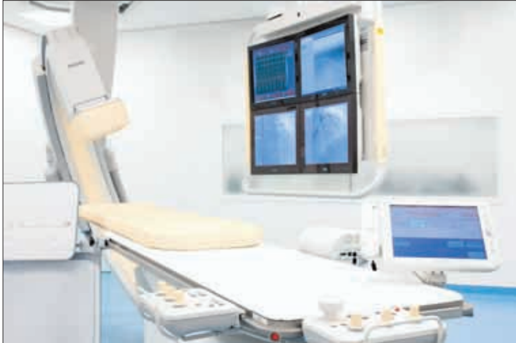
Das neue System von Philips – modernstes Röntgengerät.