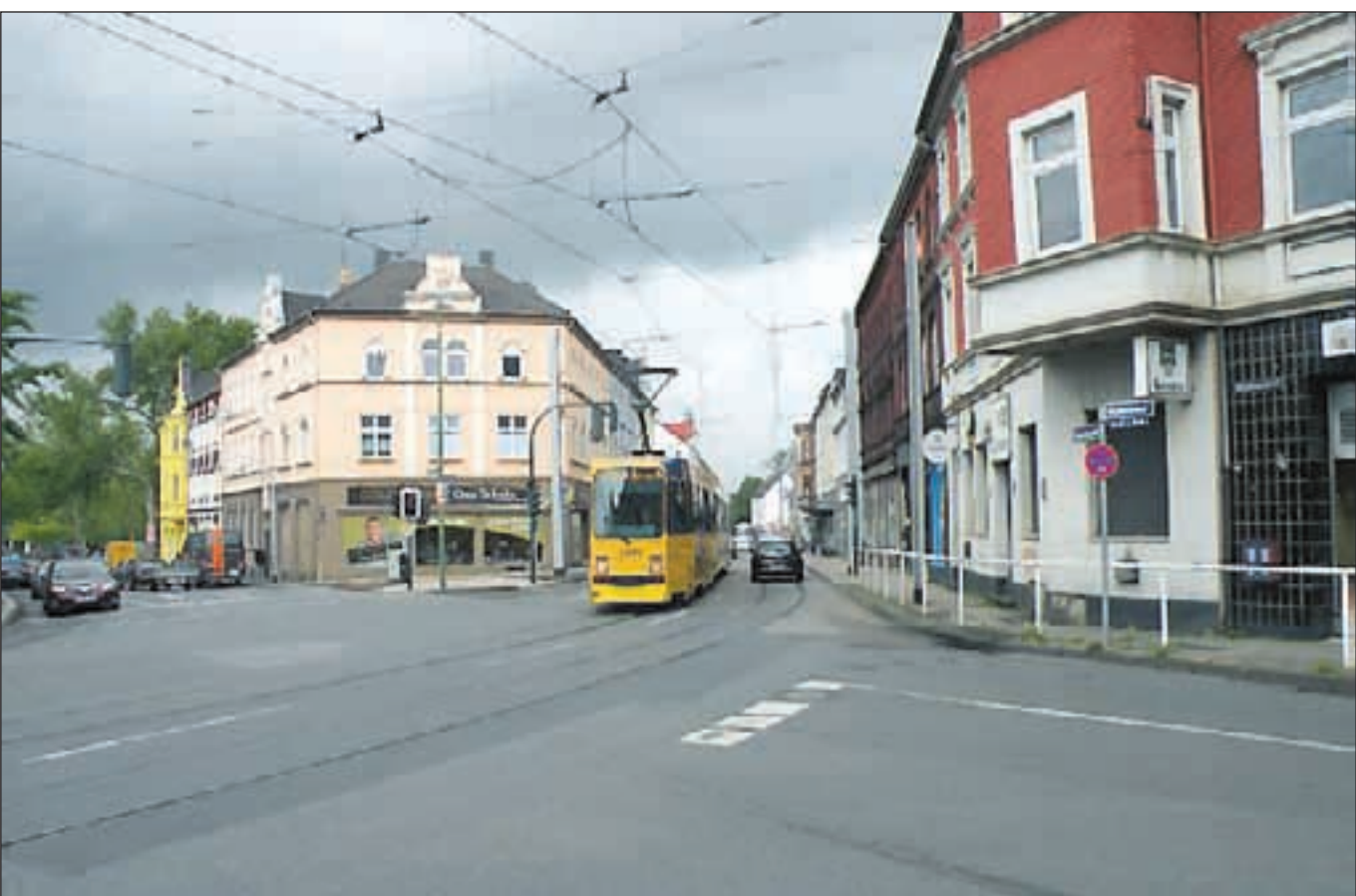
Die heutige Kulturlinie 107 fährt in eine andere Richtung – nämlich über die Straße Schonnebeckhöfe – zum Abzweig Katzenberg als die damalige Line 8, die in den Meybuschhof einbog, wie man an dem Schienenverlauf erkennen kann.

Unser historisches Foto (oben) aus der Sammlung des Katzenberger Heimatforschers Walter Rieken zeigt die Kreuzung Viktoriastraße (ehemals Kaiserstraße), Katzenberger Straße (ehem. Mittelstraße), Meybuschhof und Schonnebeckhöfe. Bild unten vom 15. August 2014 zeigt, wie sich der Bereich inzwischen verändert hat.