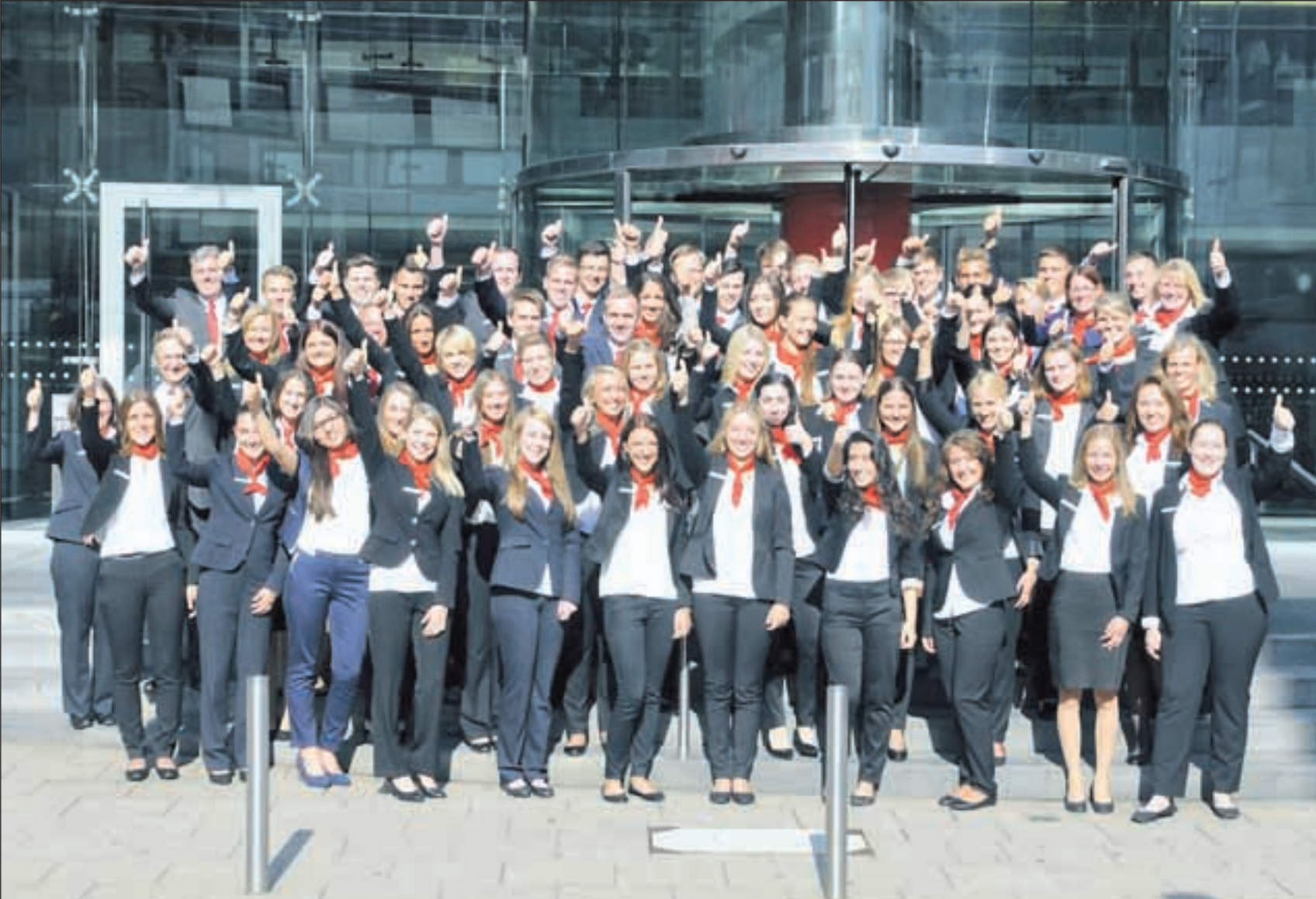
Der Ausbildungsjahrgang 2014 der Sparkasse Essen.