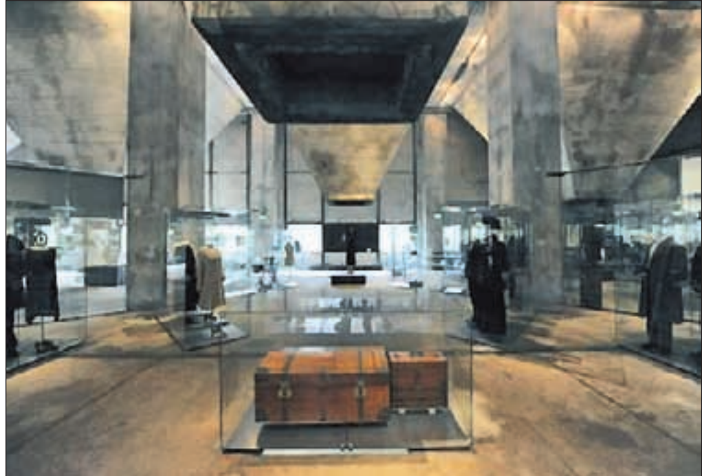
Ein Blick in die Ausstellung „1914 – Mitten in Europa“ auf der Trichterebene der Mischanlage.

Katzenberg , dienstags um 14.30 Uhr, ab dem Bürgerzentrum Kontakt, Am Katzenberger Markt 4; Schonnebeck , donnerstags um 14.30 Uhr, ab GSG Jugendhalle auf dem Markt; Stoppenberg , donnerstags, 14.30 Uhr, ab Tuttmanschule, Twentmannstraße. Die Teilnahme ist kostenlos. Jeder ist herzlich willkommen.