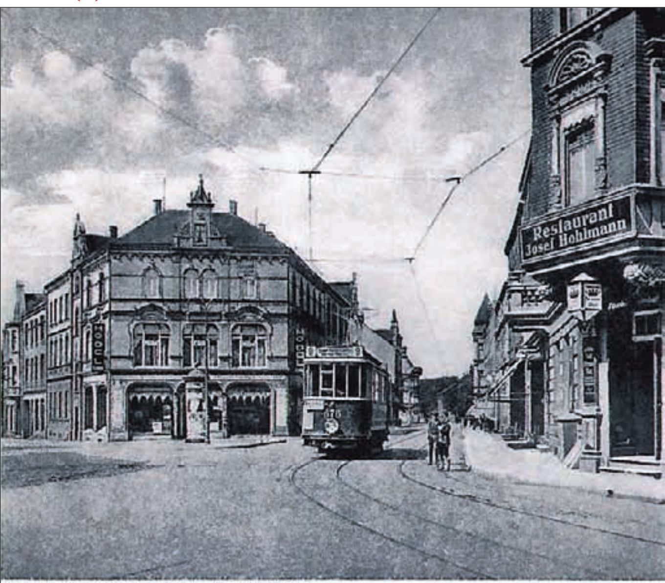
Partie zu der Kaiser- (Viktoria) und Mittelstraße (Katzenberger Straße)