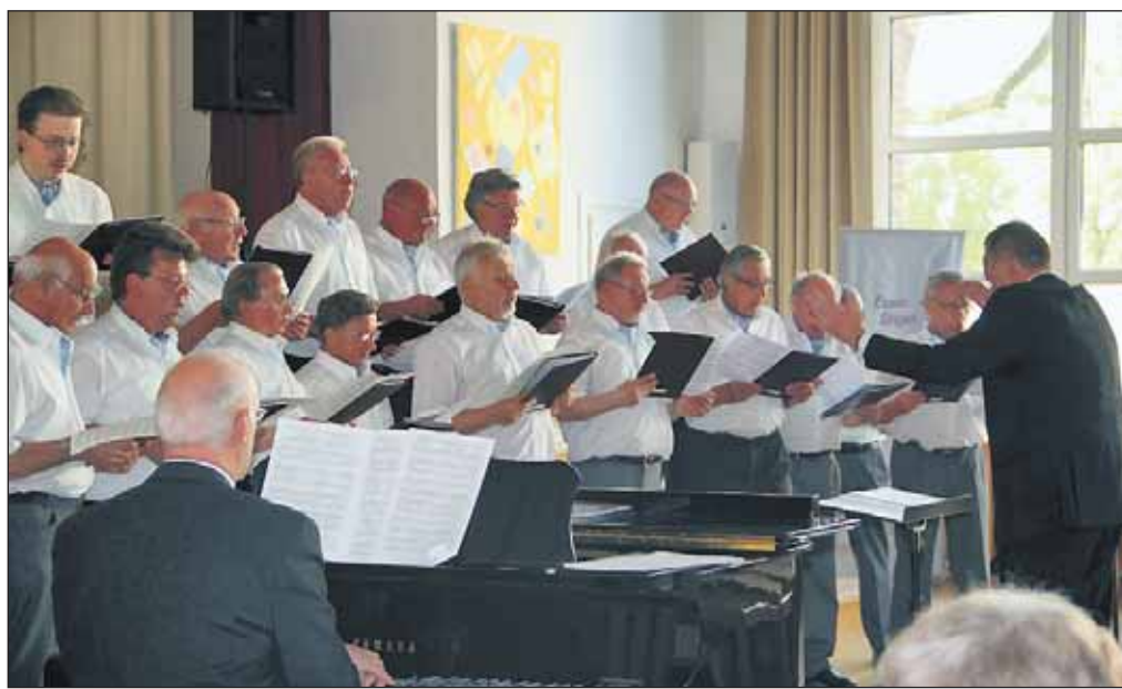
Der Chor präsentierte sich wieder einmal in Hochform und freute sich über den großen Zuspruch.