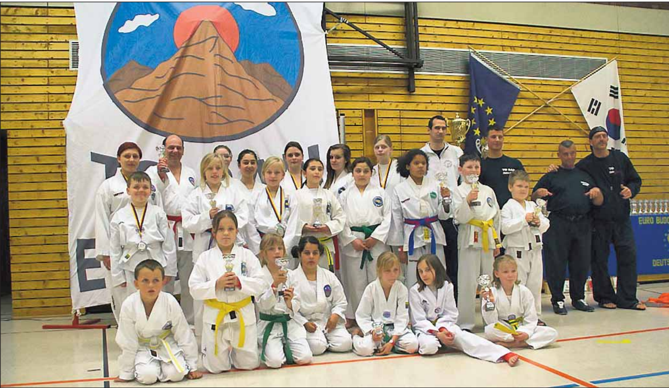
Das Foto zeigt die stolzen Katernberger Sportlerinnen und Sportler nach der Siegerehrung mit ihren Urkunden und Pokalen.