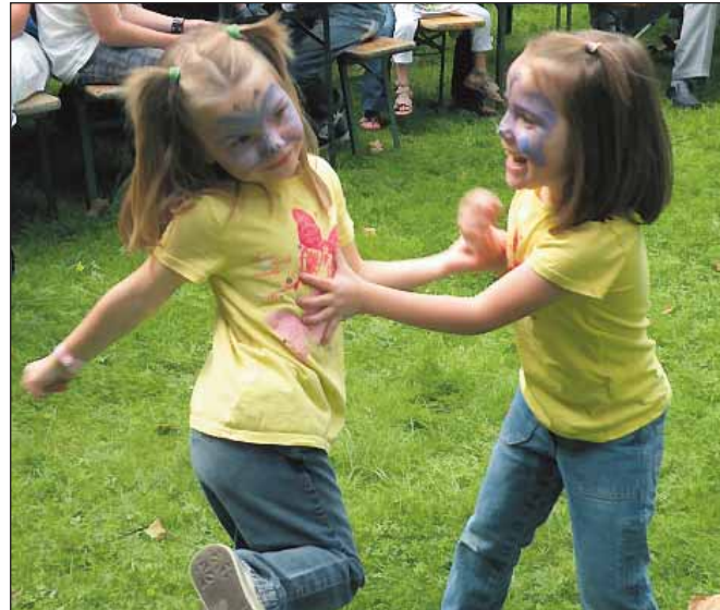
Sie freuen sich schon auf das Brunnenfest, da gibt's immer so tolle Musik.

Das Brunnenfest beginnt um 11.00 Uhr mit Musik vom Band bis zum Auftritt der Tanzgruppen und dem Fußballspiel der Bambini. Ab 15.00 Uhr bereitet sich dann die Gruppe Feel Fine auf