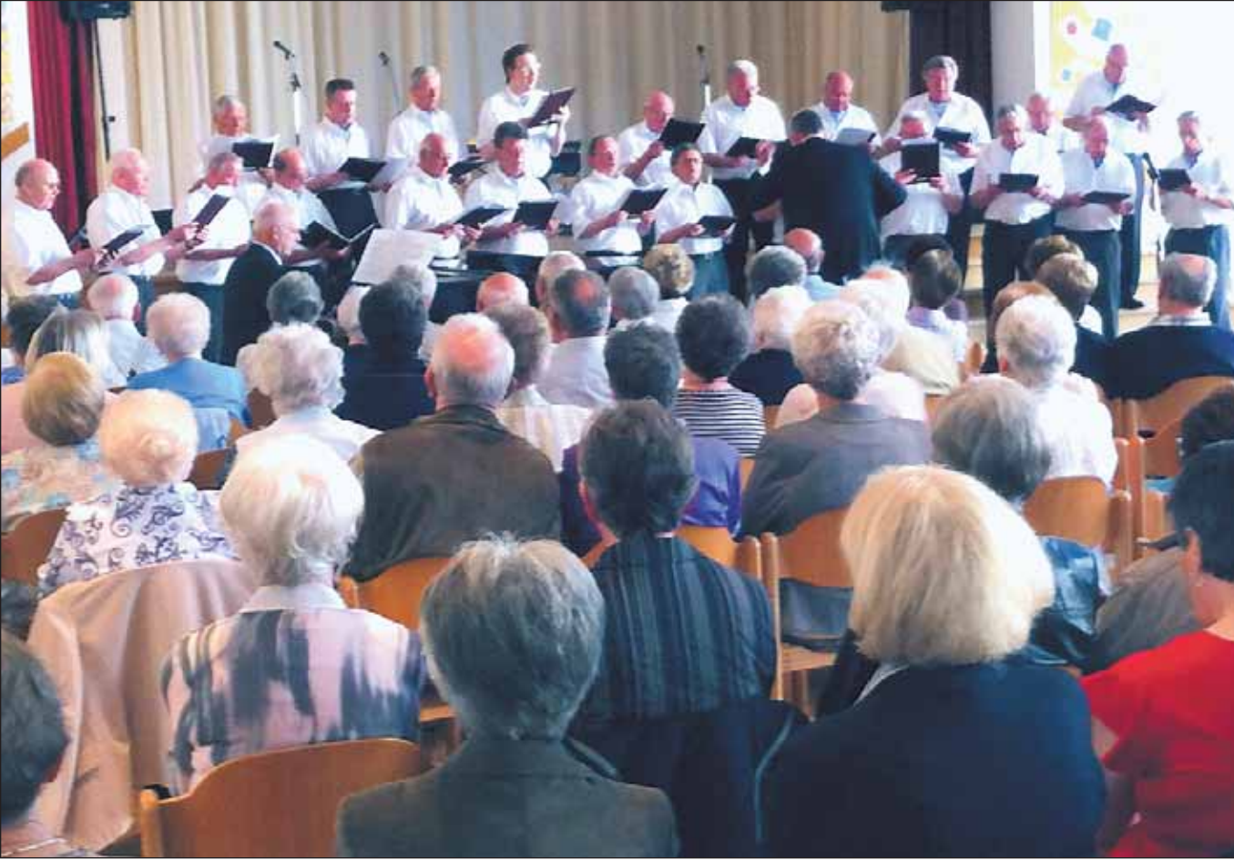
Volles Haus beim diesjährigen Frühjahrskonzert des MGV 1897 Essen-Schonnebeck.