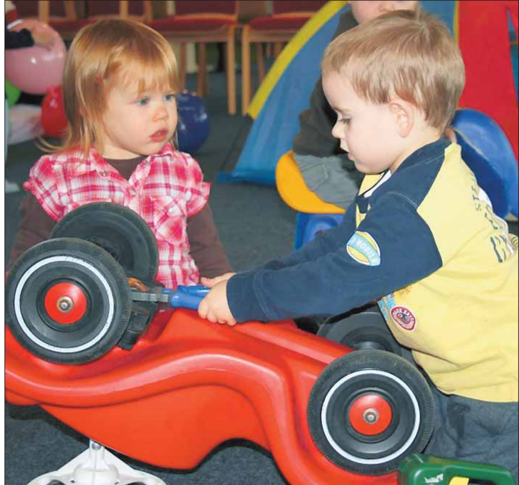
Da muss natürlich ein Fachmann ran. Der Winterspielplatz in der Christuskirche wird mitunter auch als Autowerkstatt genutzt.

Die Neurologische Klinik des Philipusstifts lädt anlässlich des Weltschlaganfalltags (29.10.2013) am Mittwoch, 30. Oktober, zu einer Informationsveranstaltung für interessierte Bürger im Haus F, Raum 2, des Philipusstifts ein. In der Veranstaltung werden neue Diagnostik- und Therapieverfahren der Akutbehandlung von Schlaganfallpatienten vorgestellt. Ein besonderer Schwerpunkt der Veranstaltung liegt bei der Behandlung von Sprach- und Sprechstörungen sowie Schluckstörungen nach Schlaganfall. Die Teilnahme ist kostenlos und ohne Voranmeldung möglich. Das Vortragsprogramm beginnt um 15.00 Uhr