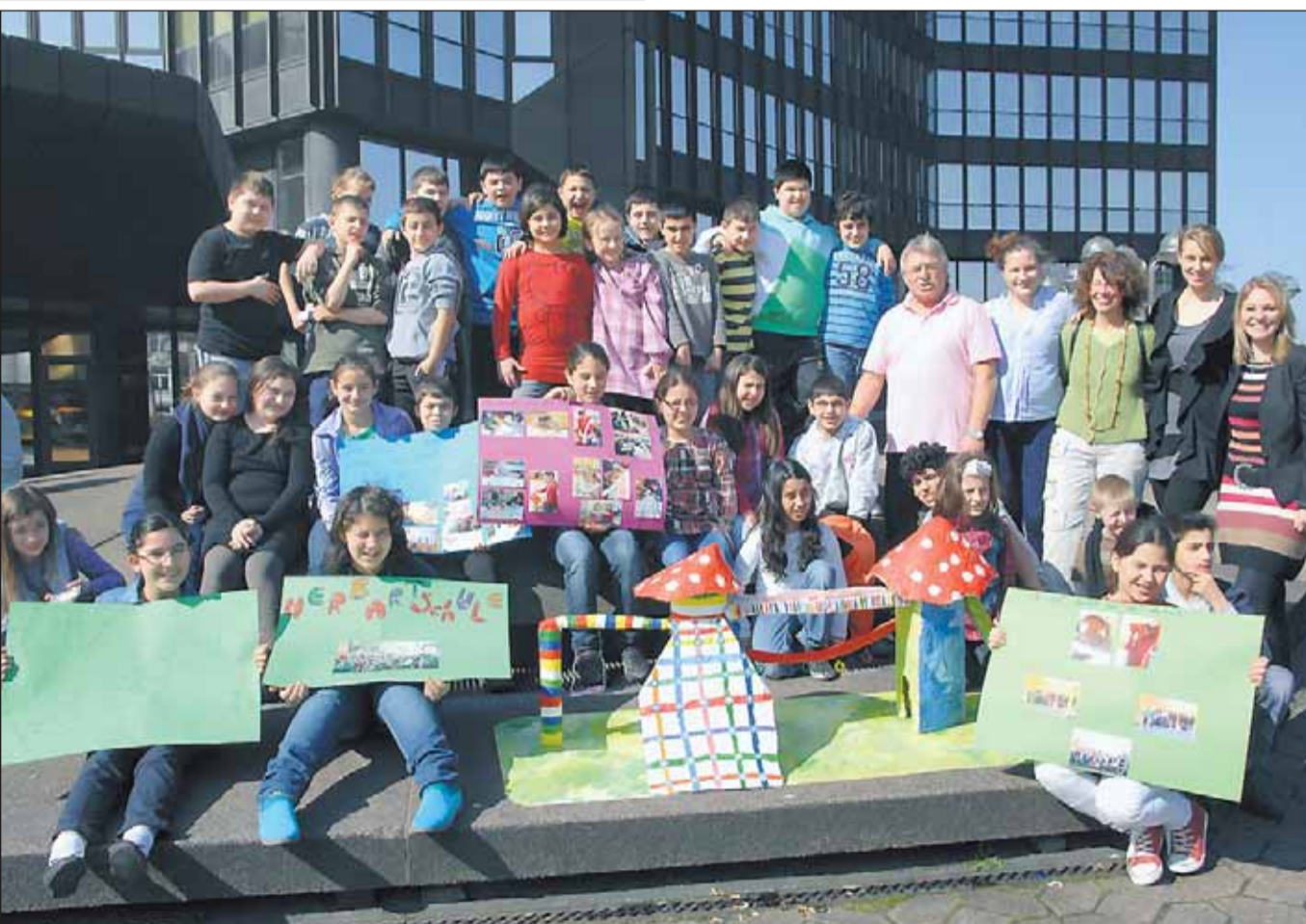
Mitreden, Mitentscheiden, Handeln lautet ein Grundsatz der ehemaligen Katernberger Herbartschule (jetzt Peter-Ustinov-Schule). Unser Foto vom 8. Mai 2012 (Wochenblatt) zeigt Viertklässler der Schule bei einem Besuch des Kinderforums im Essener Rathaus, wo sie ihre Anliegen und Vorschläge einbrachten.