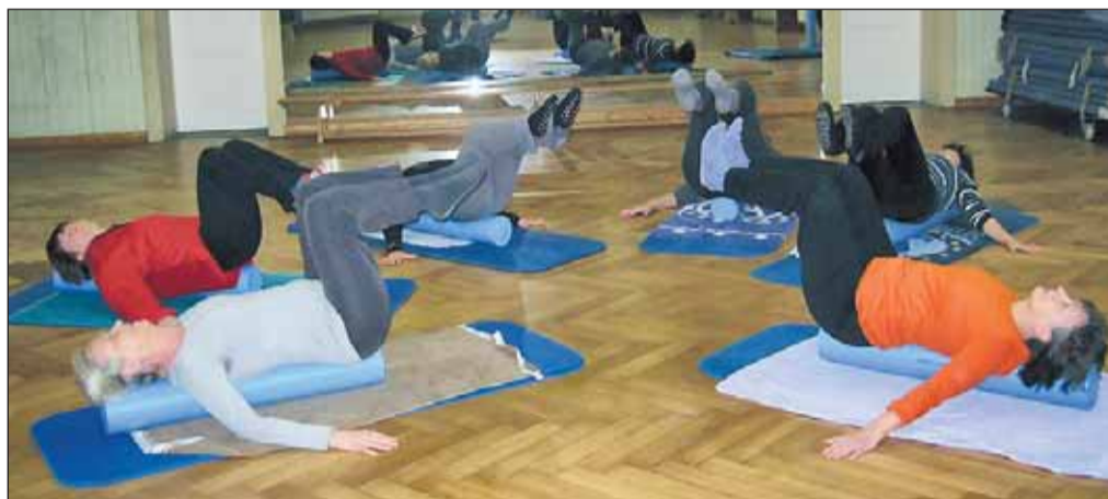
Die Teilnehmerinnen und Teilnehmer sind ganz begeistert von den neuen Übungen und Ihren Erfahrungen mit den neuen Sportmaterialien.