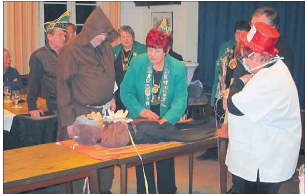
C' est la vie ! Seit dem 11. 11. 2012 hat man dem Gott des Weines und des Rausches gehuldigt. Jetzt fand er im Freizeitheim an der Steinmannshofstraße in Schonnebeck seine vorläufige Ruhestätte.