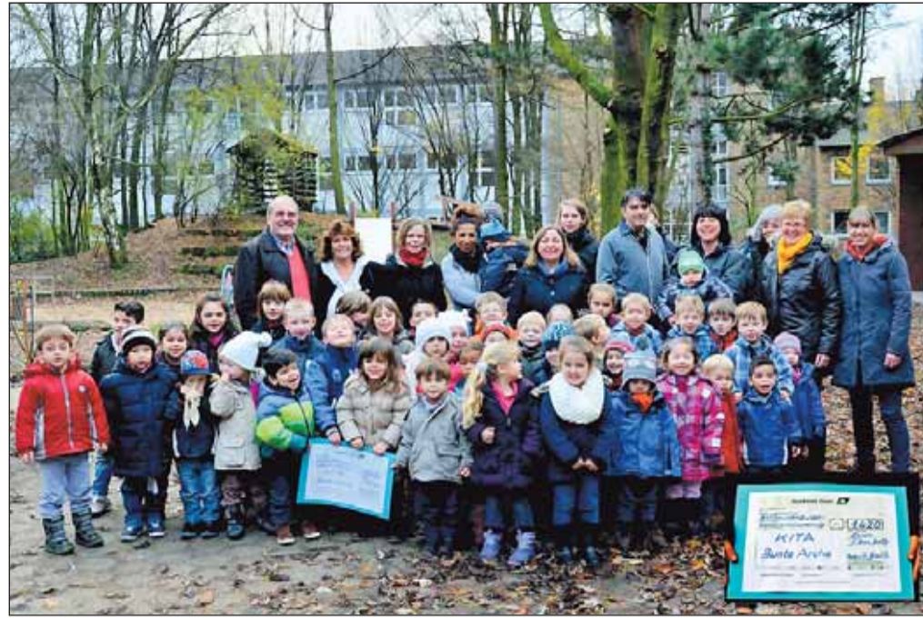
Das „Gold-Brautpaar“ im Kreise der Kinder bei der Übergabe des Geldes. Dank der großzügigen Spende ihrer Gäste kamen 1420,00 Euro zusammen. Nun wird es demnächst ein schönes Holz-Spielhaus für die Kleinsten der Kita Bunte Arche geben.

Infos: Essener Str. 38 – Tel.: 0201 45857451 www.sks-hartwig.de Öffnungszeiten: Mo. – fr. 9.30 – 17.00 Uhr