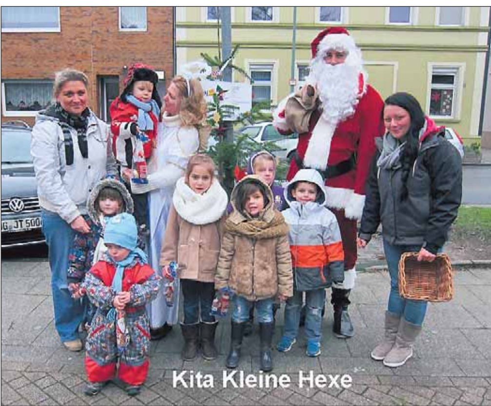
KiTa Kleine Hexe