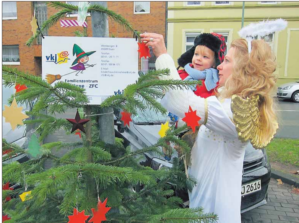
Weihnachtsbauschmücken macht Spaß, und manchmal hilft sogar ein Engel dabei, wie hier am Nikolaustag in Schonnebeck.