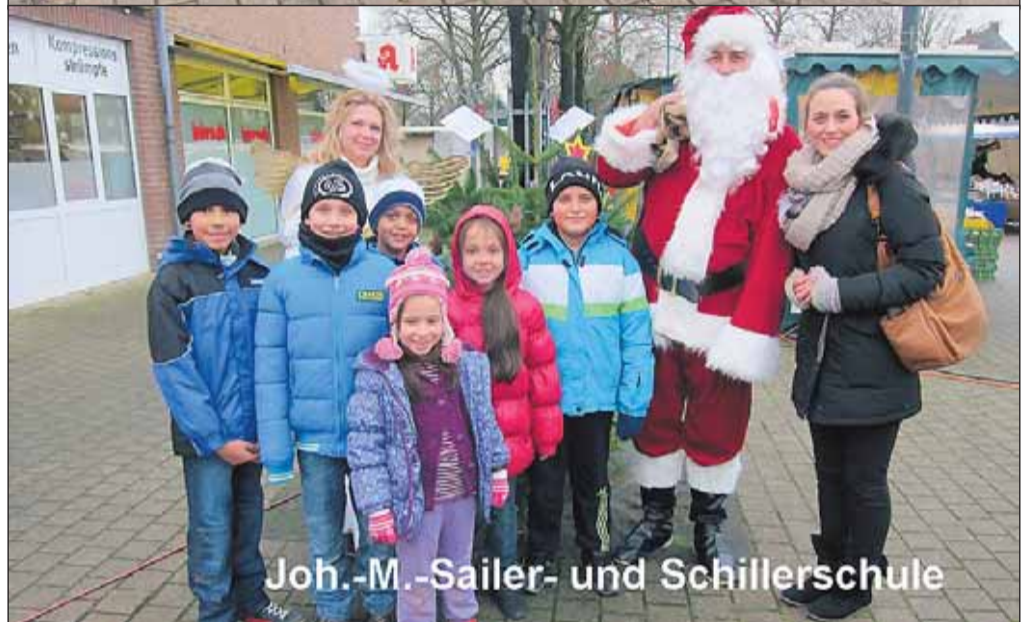
Joh.-M.-Sailer- und Schillerschule