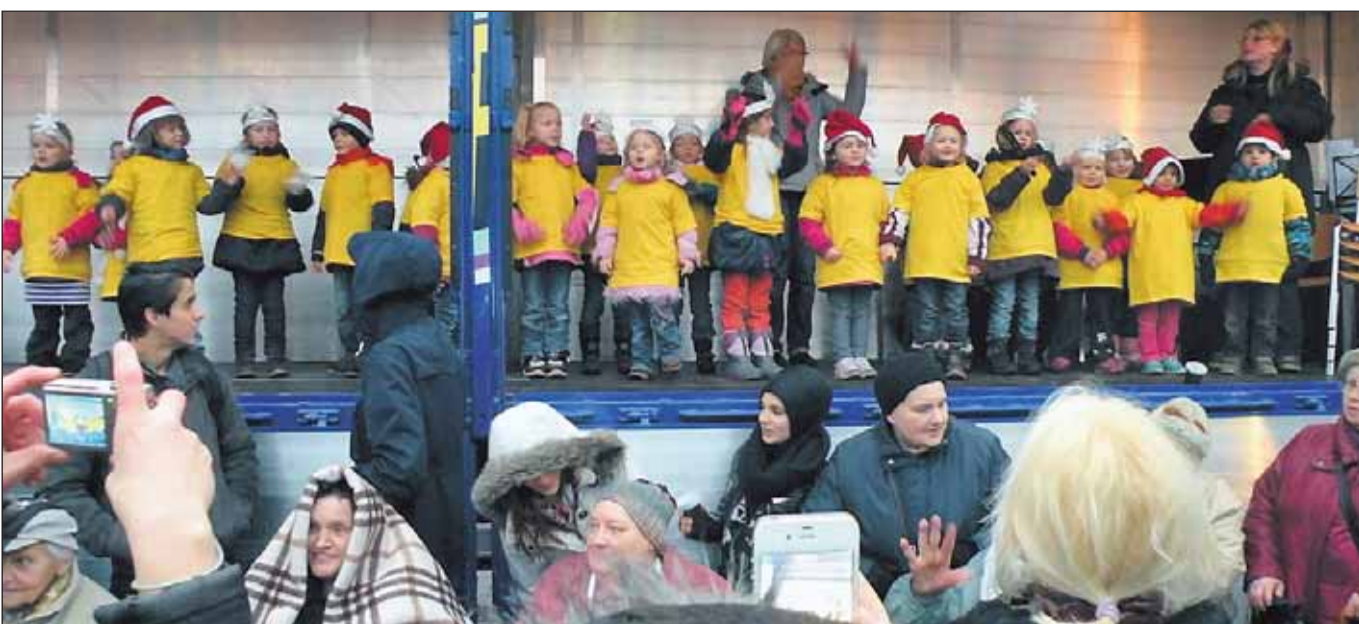
Die fröhlichen Musikzwerge der KiTa Familienzentrum Katernberg-Mitte machten das schlechte Wetter für die Dauer ihres Auftritts vergessen.