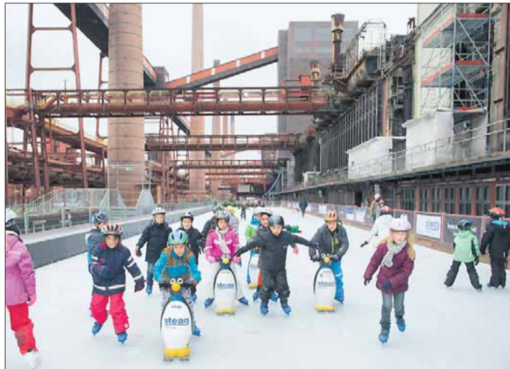
Die Eisbahn auf der Kokerei Zollverein, eine beliebte Adresse für Schulklassen.

Das Fachgeschäft ganz in Ihrer Nähe Essen-Stoppenberg Gelsenkirchener Straße 19 Telefon 0201 – 21 13 44