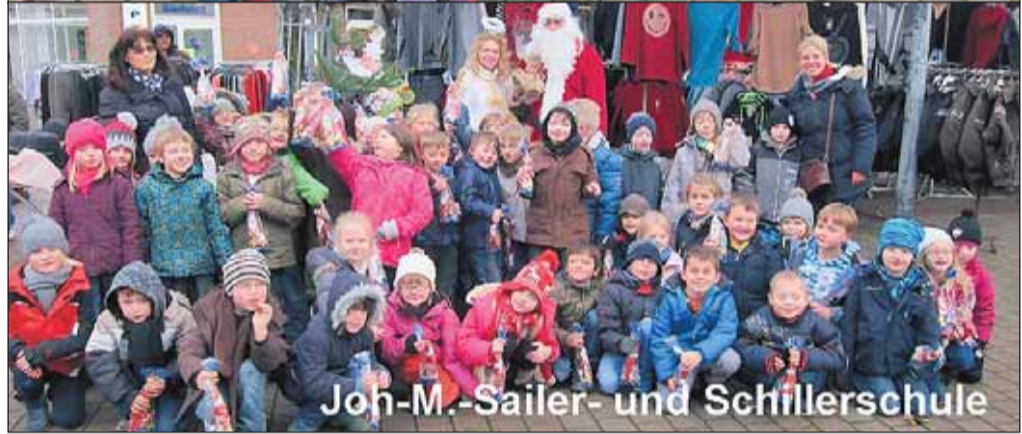
Joh.-M.-Sailer- und Schillerschule