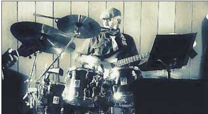
Einem Streifzug durch die Geschichte der Pop-Musik kann man der Gruppe „Zippi Pops“ am Sonntag ab 12.00 Uhr folgen.