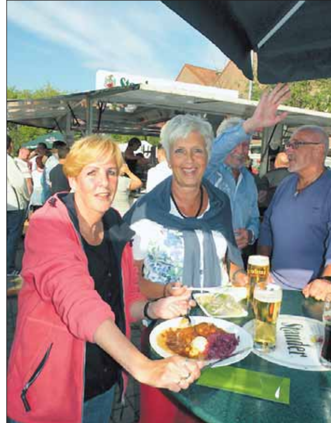
Nette Menschen und vielfältige Köstlichkeiten gehören zum Standard auf den Schonnebecker Marktfesten.