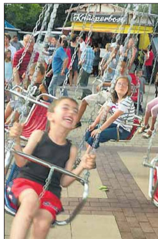
Herrlich - dieses Kribbeln im Bauch.