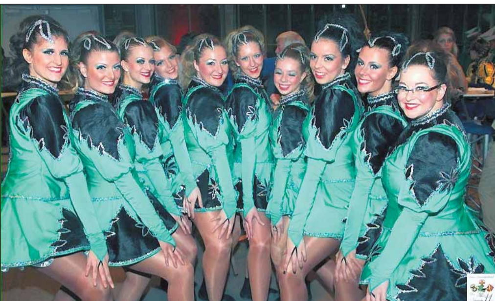
Sie dürfen sich bei jedem Auftritt tosenden Beifalls und anhaltender Dacapo-Forderungen sicher sein - die vielfach ausgezeichneten Show-Tanzgruppen der KG „Närrische Elf“ Dancing Fire und Dancing Flames. So auch am kommenden Sonntag um 16.00 Uhr auf dem Schonnebecker Marktfest.