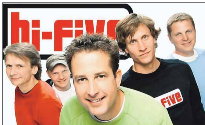
Weiter geht's am Samstag beim Dämmerochsen ab 17.30 Uhr mit der Band „hi Five“. Sie nimmt die Besucher mit auf einen musikalischen Ausflug in die vergangenen Jahrzehnte.

Rund 30 Infostände von Firmen, Schulen, Vereinen, Verbänden und Institutionen laden zum Bummeln, Plaudern und Fachsimpeln ein. Am Samstagabend kann man bei einem gemeinsamen Dämmerochsen den Sommer genießen, der Sonntag steht dann ganz im Zeichen der Familie. Sonne und blauer Himmel sind bestellt.