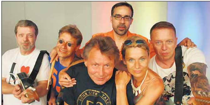
Ab 15.00 Uhr präsentiert sich am Sonntag die Gruppe „Ruhr-schnellweg“ als Botschafterin des Ruhrgebiets.