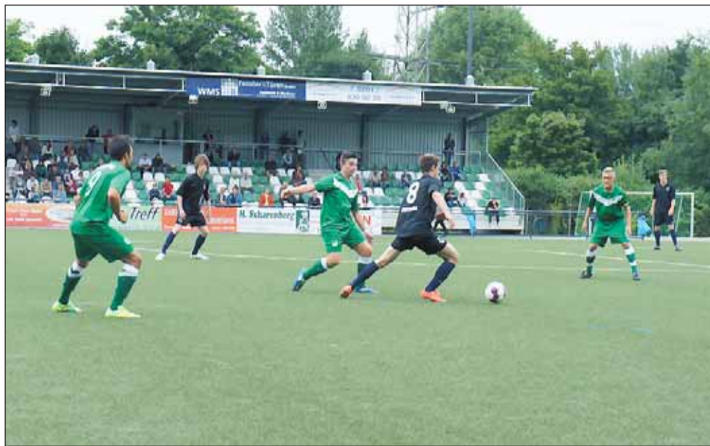
Spielezene beim HUK-Coburg U19-Cup 2012.