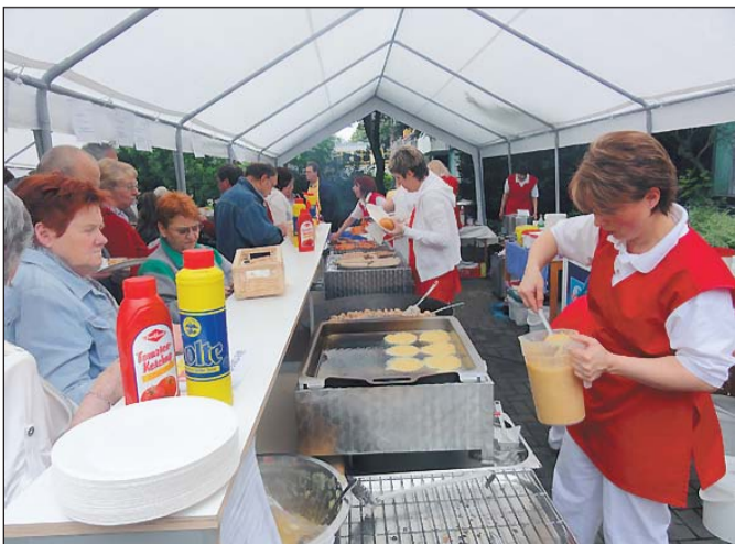
.....Leckeres für Gaumen und Kehle -