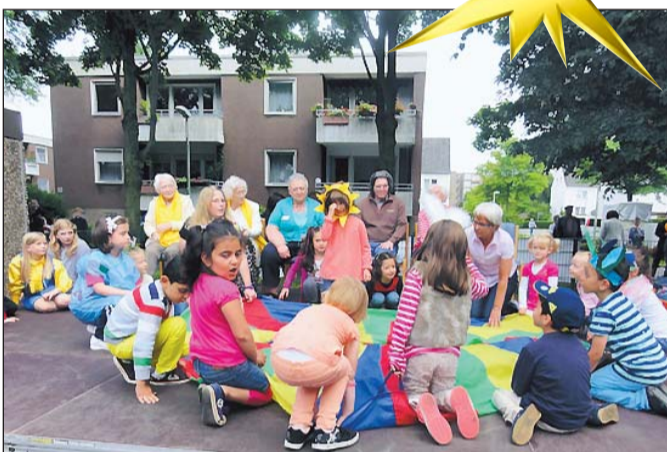
.....gemeinsame Darbietungen der Kitakinder mit dem Seniorenrhonor