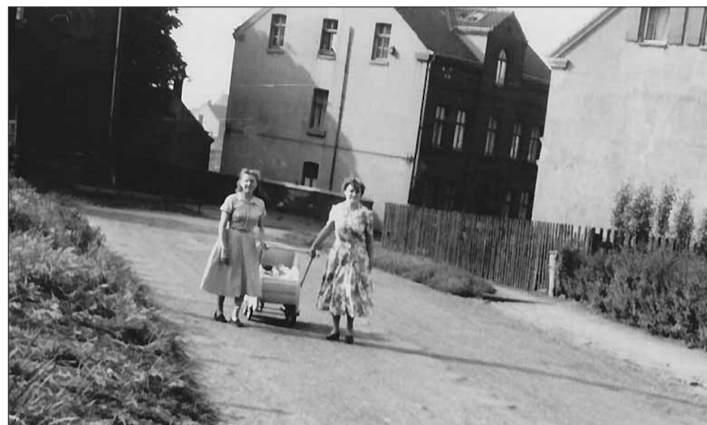
Wie's beispielsweise früher war: Hausdyckerfeld 1957.

Fall vom Betroffenen getestet werden. Auch bei eingeschränktem Sehen aufgrund von Glaukom oder diabetischer Retinopathie ist eine Erprobung sinnvoll. Auch für andere Fälle von Sehbehinderung sind wir in Essen-Katernberg der richtige Ansprechpartner. Für alle Fälle von notwendiger Vergrößerung, von der verstärkten Lesebrille über Lupen und sämtlichen elektronischen Hilfsmitteln, sogenannten Lesegeräten, sowie die richtige Beleuchtung stehen wir vor Ort mit Rat und Tat zur Verfügung. So müssen unsere Kunden auch für den späteren Service keine langen Wege in Kauf nehmen. Weitere Informationen bei Optik Faude - Katernberger Str.19 Essen-Katernberg, Telefon 0201 302699.