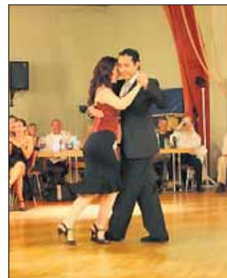
Beim Tango Argentino sind Umräumung, Bewegung und Improvisation maßgebliche Komponenten.

Der Tango Argentino wurde von der UNESCO im Jahre 2009 zum Weltkulturerbe ernannt. Sie stellte fest: „Der Tango entstand zu Beginn des 20. Jahrhunderts in der einfachen Bevölkerung von Buenos Aires und Montevideo im Becken des Rio de la Plata (...)“. Der Tango Argentino Herne e.V. erklärt: Tango Argentino ist mehr als einfach nur ein Tanz. Die Musik ist einzigartig und heute, nach über 100 Jahren, immer noch aktuell. Die klassischen Musiktitel begeistern weltweit Menschen die ihre Leidenschaft bei den sogenannten Milongas (Tanzveranstaltung) regelmäßig ausüben. Beim Tango Argentino ergänzen sich Umräumung, Bewegung und Improvisation ideal und wirken sich positiv auf Gesundheit und Wohlbefinden aus. In der Jugendhalle Schonnebeck können Paare und Singles am Sonntag, dem 21. April 2013 diesen wunderbaren Tanz lernen. Interessierte jeder Altersgruppe und Kultur haben um 18:00 Uhr die Möglichkeit, ein neues Hobby kennen zu lernen. Der Workshop richtet sich an Anfänger ohne Vorkenntnisse. Schuhe mit glatter Sohle werden empfohlen.