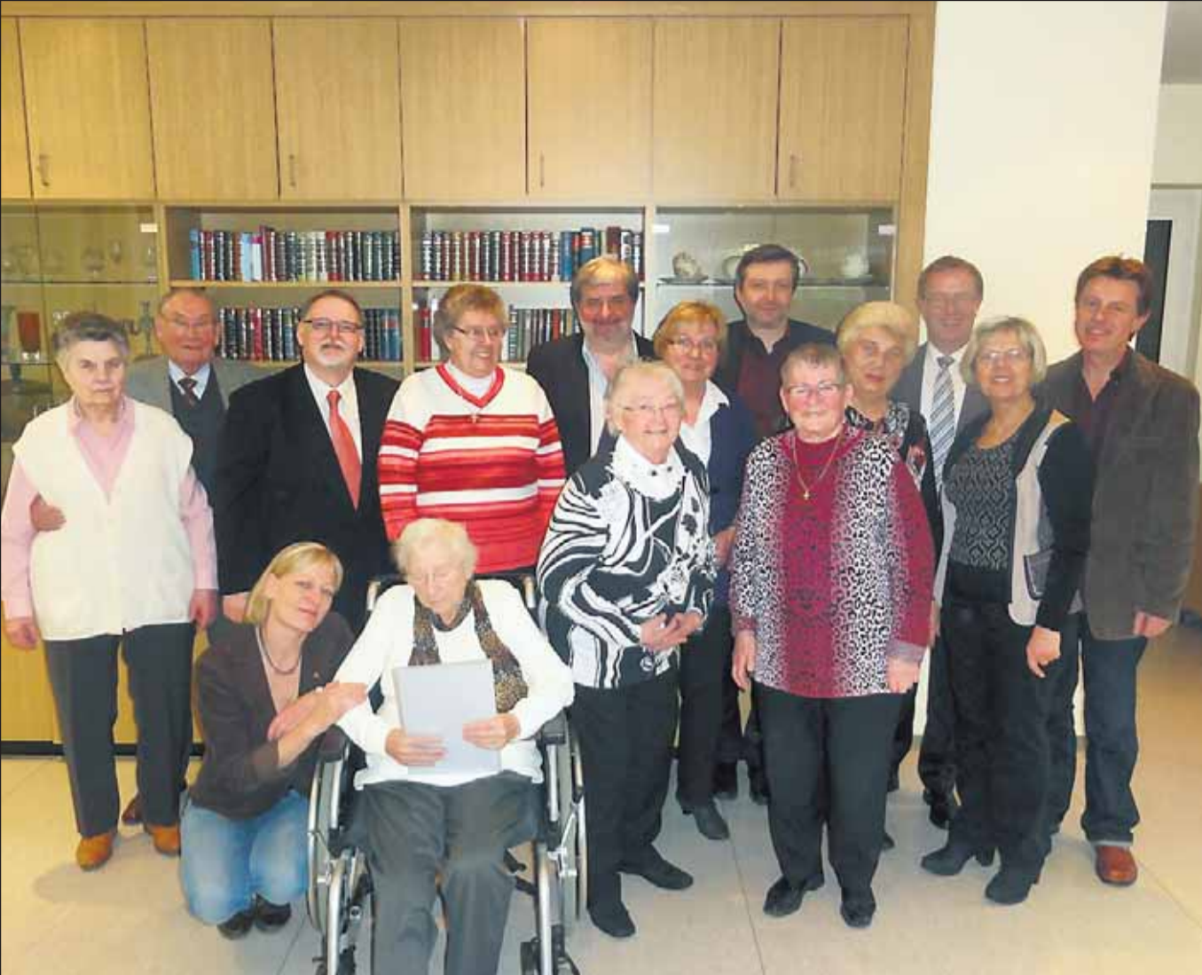
In einer Feierstunde wurden die Mitglieder der AWO Katernberg geehrt