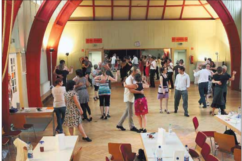
Wer seine Leidenschaft für den Tango Argentino wecken lassen möchte, hat in der Jugendhalle Schonnebeck Gelegenheit dazu.