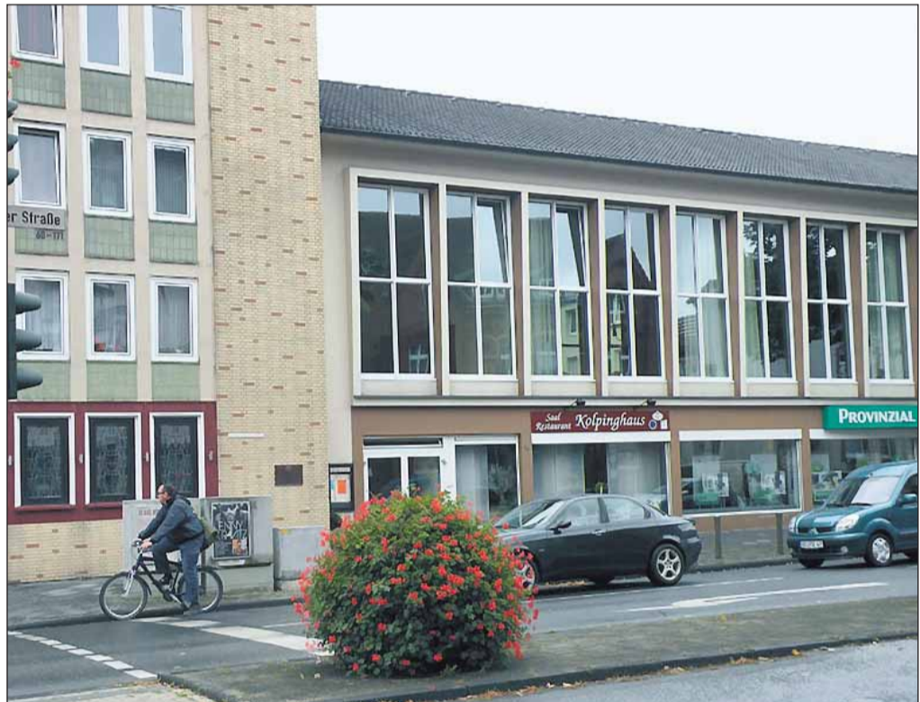
Das Kolpinghaus Rotthausen ist seit Jahren eine ausgewählte gute Adresse für den Verkauf günstiger Marken-Schuhe.