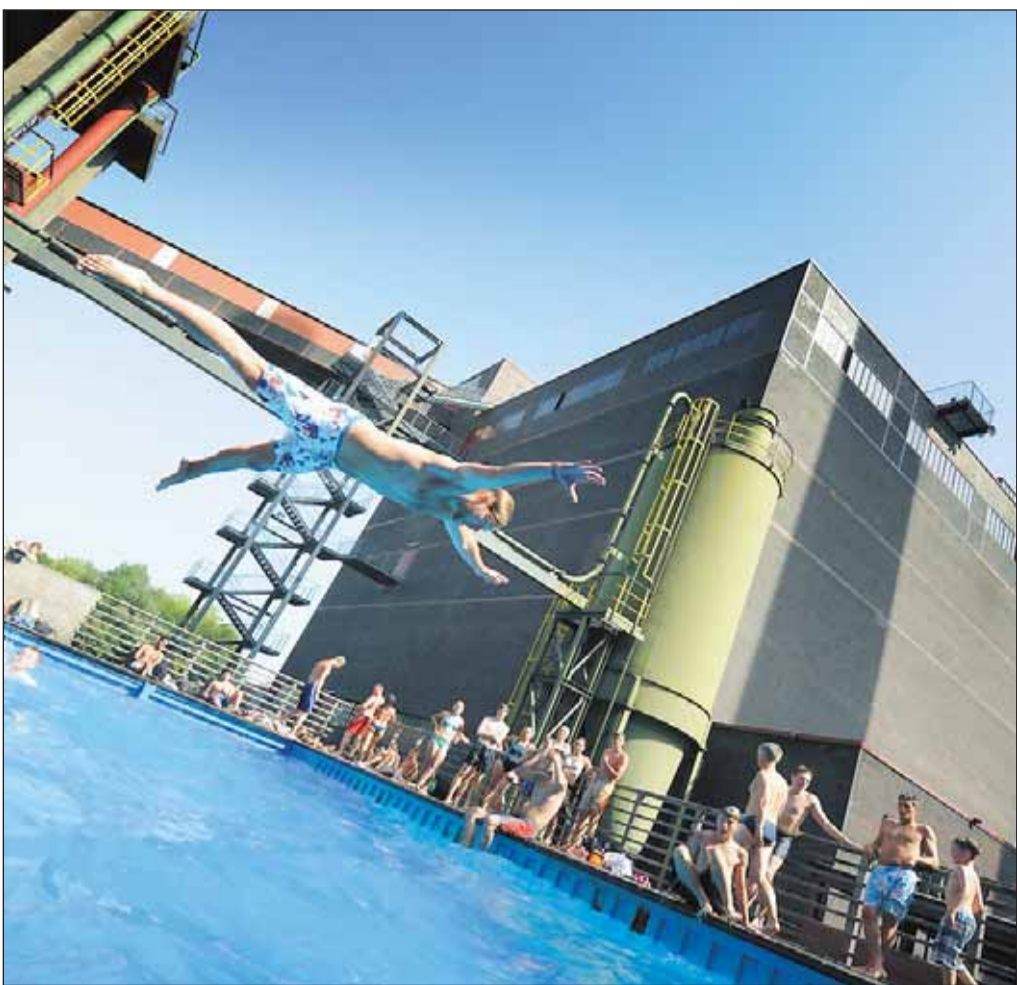
Nicht mal Fliegen ist schöner. Eine Aufnahme vom Werksschwimmbad aus dem vergangenen Jahr 2012 bei 38 Grad im Schatten.