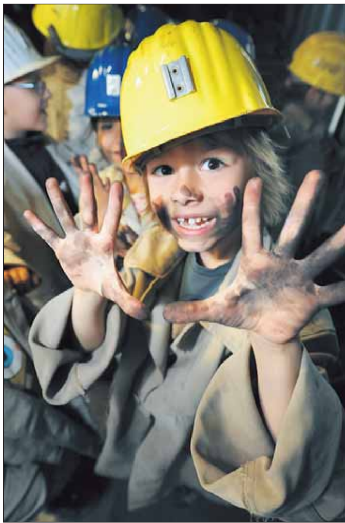
Schwarzes Gold im Gesicht und an den Händen. Da ist nach der Kohlen- ganz bestimmt noch eine Kinderwäsche fällig.

Es war einmal... Die Legende von der Entdeckung der Kohle. Wo kommt die Kohle eigentlich her und wie ist sie überhaupt entdeckt worden? Bei diesem Angebot können Kinder spielerisch lernen, wo die Kohle mal herkam