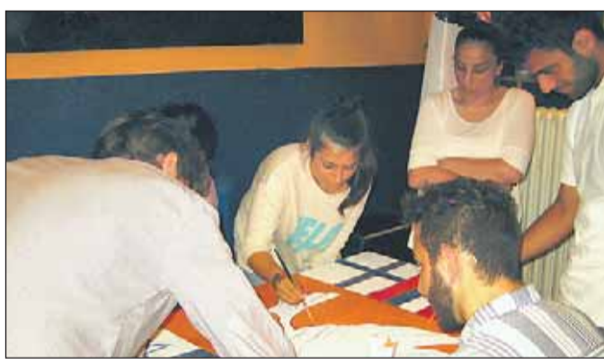
Malaktion mit internationaler Beteiligung.

Seit nunmehr 4 Jahren veranstaltet das Jugendzentrum Schonnebeck während des muslimischen Fastenmonats Ramadan, als Zeichen für ein Interkulturelles Miteinander, ein großes Fastenbrechen. In diesem Jahr war sogar eine internationale Gruppe zu Gast. Das Jugendamt Essen lädt einmal im Jahr eine internationale Delegation von Jugendlichen in das Sommercamp am Baldeysee ein. Die Teilnehmer/innen stammen aus der Essener Partnerstädter Sunderland (England), Tampere (Finnland), Grenoble (Frankreich), Tel Aviv (Israel) und Nishnij Nowgorod (Russland). Im Rahmen ihres Aufenthaltes in Essen haben die