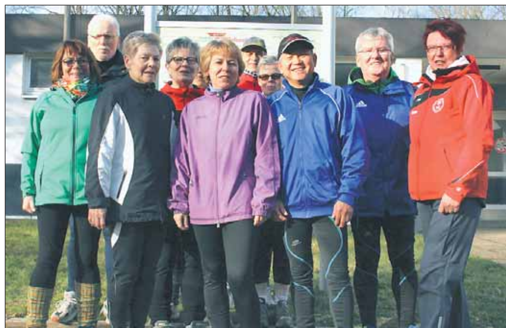
Aktive Gruppe beim Breitensportverein Gelsenkirchen e. V. Jeder kann mitmachen. Kostenloses Probetraining sofort möglich.