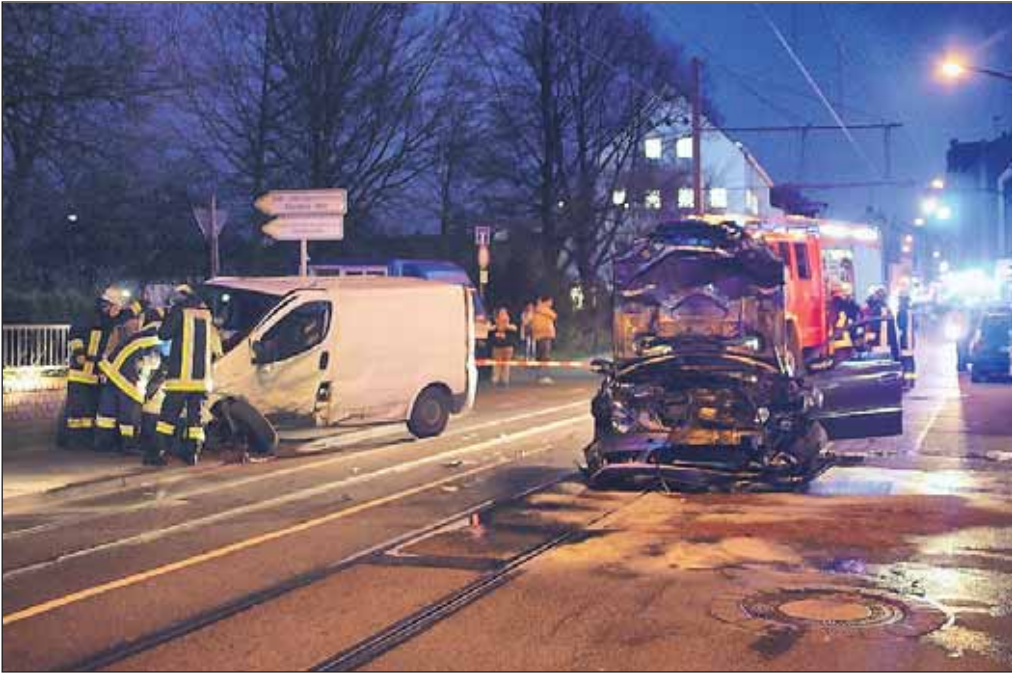
Ein schockierendes Bild bot sich an der Unfallstelle.