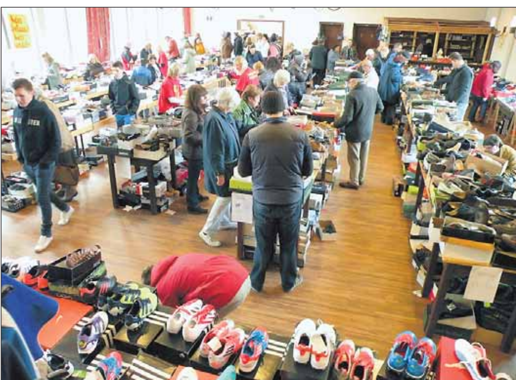
Das Kolpinghaus Rotthausen, hier ein Foto aus 2012, ist seit langem eine ausgewählt gute Adresse für den Verkauf günstiger Marken-Textilien und -Schuhe.