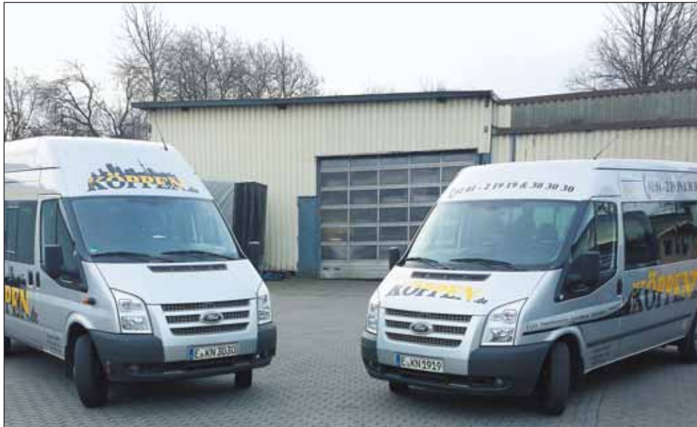
Der neue 15sitzer (li.) und der 8sitzer mit überbreiter Rollstuhlrampe (re.) sind derzeit die Stars im Köppen-Fuhrpark an der Elisabethstraße 14.