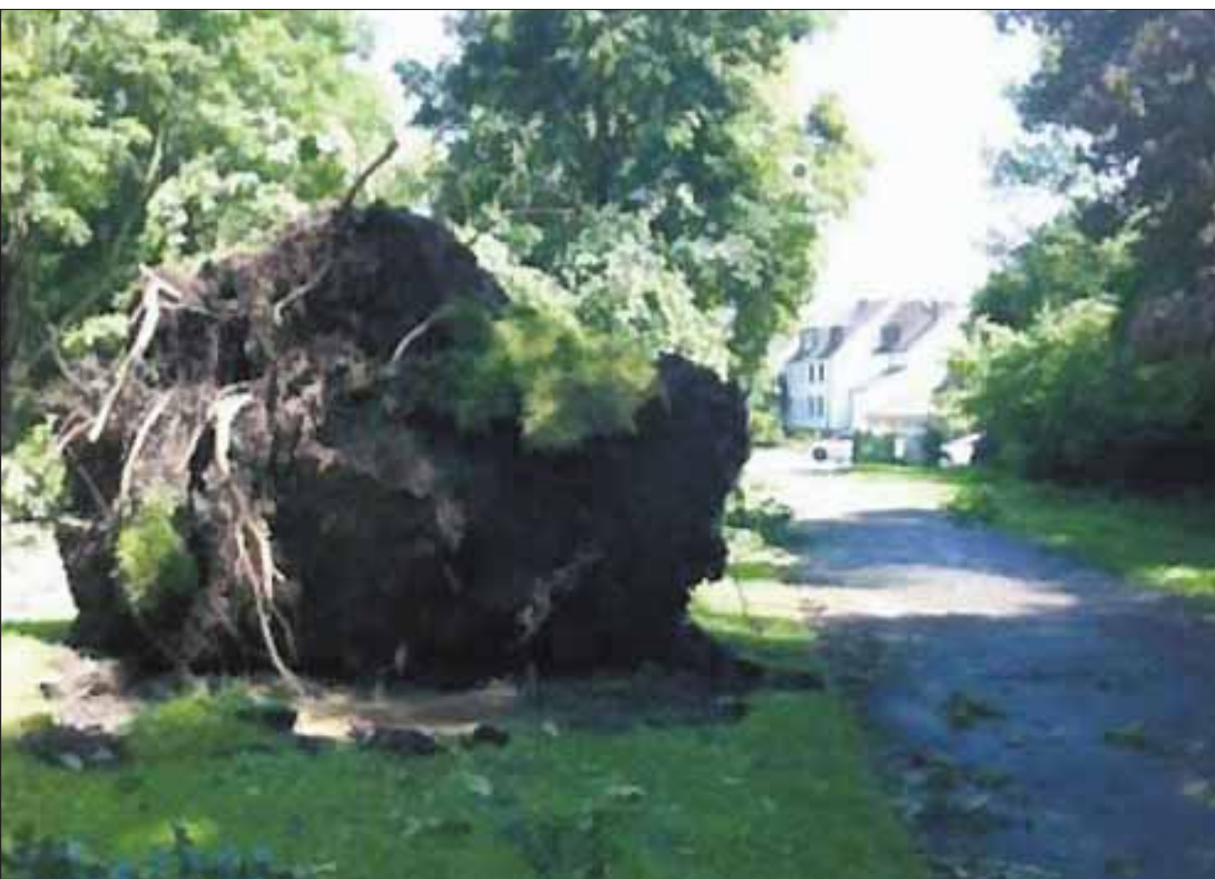
Entwurzelter Baum Auf der Reihe zwischen Kraspohshöhe und Schemannstraße.