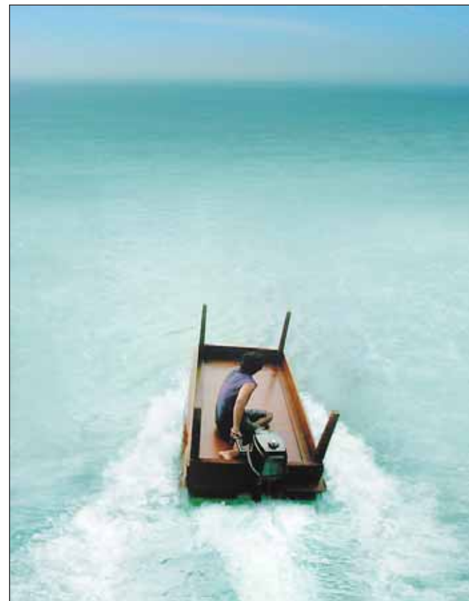
Sinnbild der großen internationalen Kunstaussstellung „zur nachahmung empfohlen! expeditionen in ästhetik und nachhaltigkeit“ vom 18. Juli bis 4. September 2014 auf Zollverein. Foto: Allora & Calzadilla „Under Discussion“

Das vielfach ausgezeichnete Ausstellungsprojekt „zur nachahmung empfohlen! expeditionen in ästhetik und nachhaltigkeit“ (www.zollverein.de/zne, www.z-n-e.info) macht Station auf Zollverein. Vom 18. Juli bis zum 4. September 2014 präsentiert die Kuratorin Adrienne Goehler in Kooperation mit der Stiftung Zollverein über 50 nationale und internationale Exponate aus Kunst, Wissenschaft, Film und Architektur. Die umfassende Ausstellung auf Zollverein Schacht XII, in Halle 6 und Halle 8, wird begleitet von kostenfreien Workshop-Angeboten für alle Generationen und einem interdisziplinären Symposium mit anschließendem Theaterabend am 16. August 2014. Das gesamte Begleitprogramm wurde in Zusammenarbeit mit der RWE Stiftung und der Stiftung Zollverein entwickelt. Zeit: 19.7.-4.9.2014 Di bis So, jeweils 12-18 Uhr, Mo geschlossen; Eröffnung: 18. Juli 2014, 19 Uhr, Areal A [Schacht XII] Halle 6 [A6]; Eintritt: 5 € [erm. 3 €], Familienticket 12 Euro | Gruppen (ab 5 Pers.) | Schulklassen 20 Euro; Teilnahme an Workshops und Symposium kostenfrei; Anmeldung erbeten unter: veranstaltung@zollverein.de; Veranstalter: Stiftung Zollverein; Info: Fon +49 201 2 4 6 8 10, info@zollverein.de, www.zollverein.de, www.z-n-e.info Ort: Zollverein, Areal A [Schacht XII], Halle 6 [A6] und Halle 8 [A8], Gelsenkirchener Straße 181, 45309 Essen; Infos: Fon +49 201 2 4 6 8 10 www.zollverein.de/zne www.z-n-e.info.