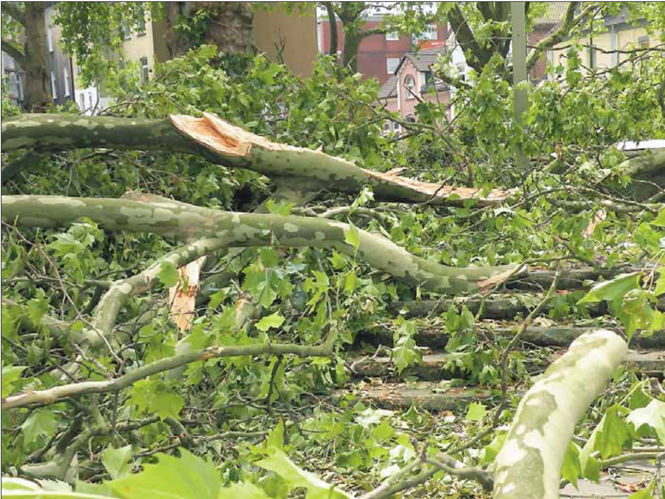
Das Mahnmal am Katernberger Markt unter Bäumen und Ästen begraben.