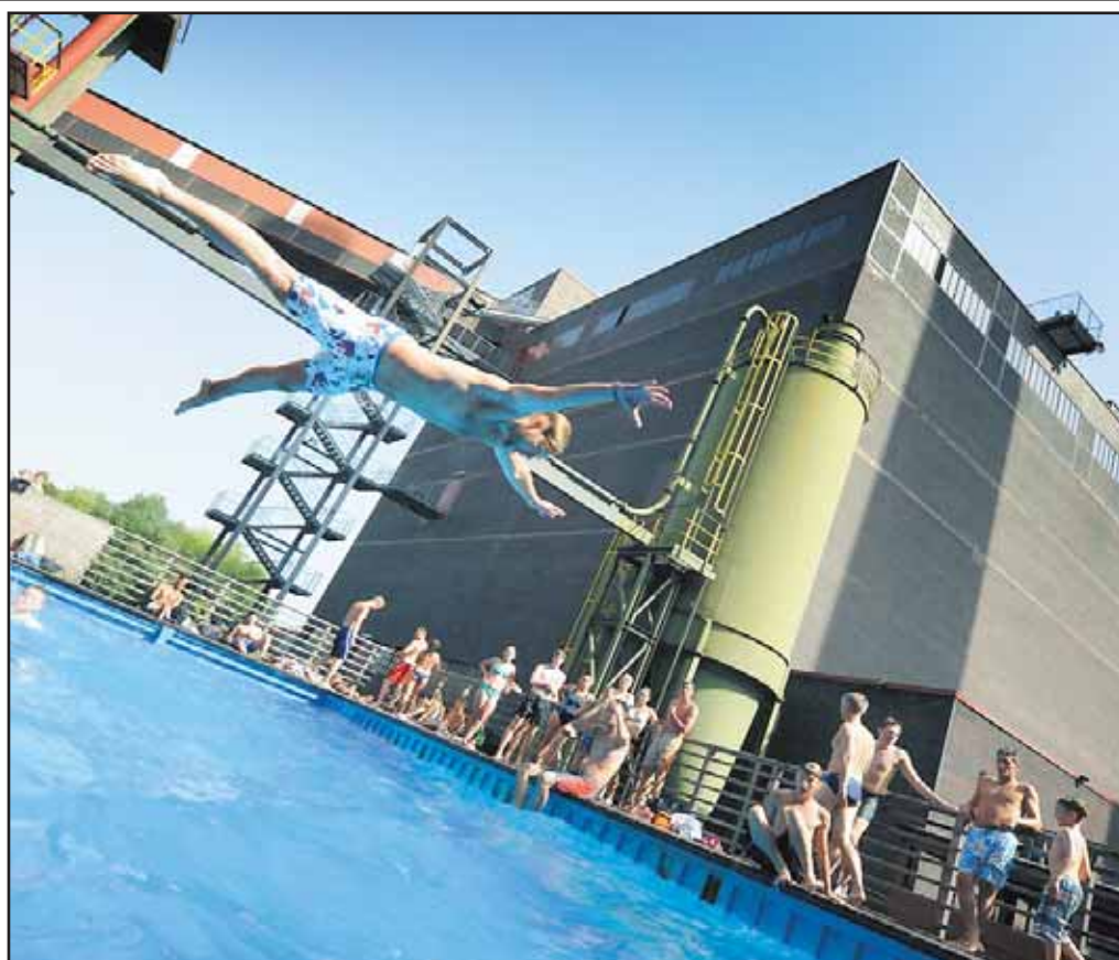
Nicht mal Fliegen ist schöner. Eine Aufnahme vom Werksschwimmbad aus dem vergangenen Jahr 2012 bei 38 Grad im Schatten.