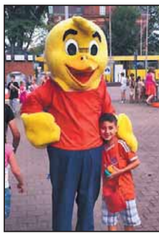
Kunterbunter Sommerzauber, Katernberg