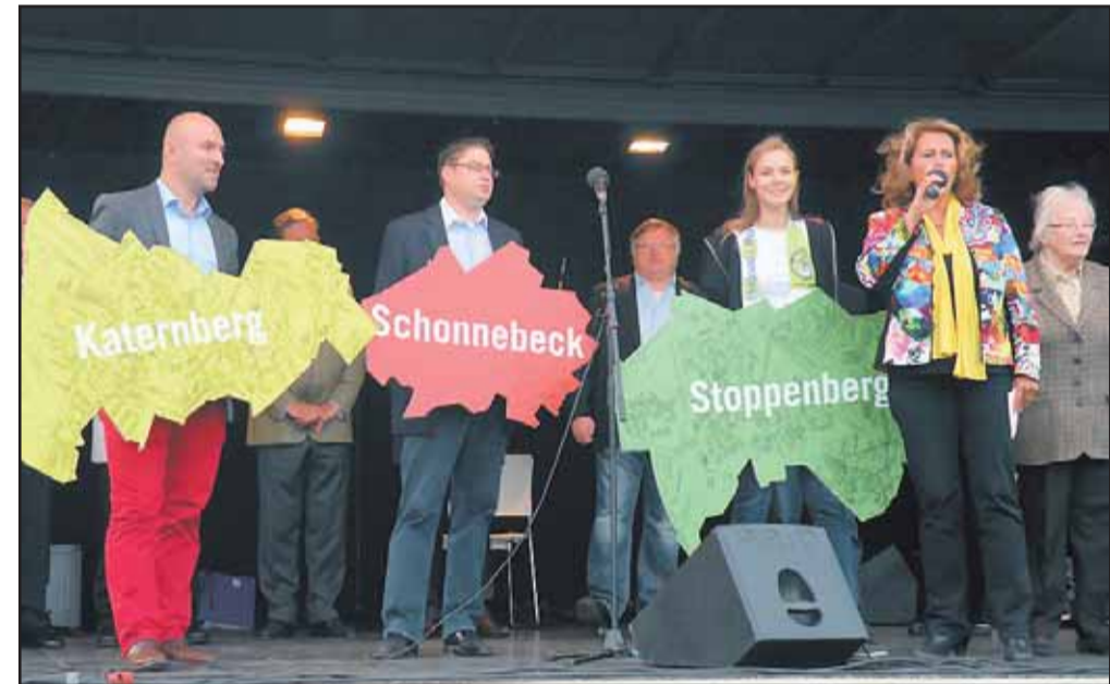
Zechenfest auf Zollverein