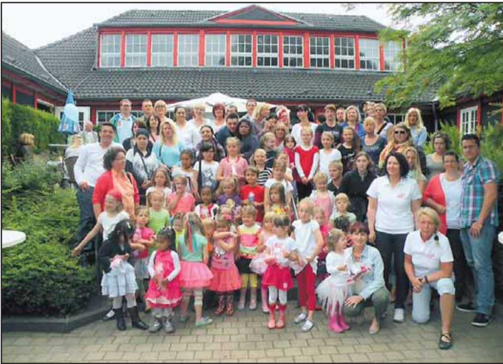
Marktfest in Schonnebeck