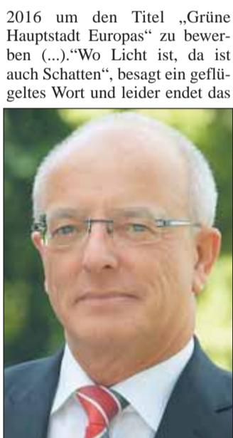
OB Reinhard Paß

2016 um den Titel „Grüne Hauptstadt Europas“ zu bewerben (...). „Wo Licht ist, da ist auch Schatten“, besagt ein geflügeltes Wort und leider endet das Jahr 2013 mit einem Wermutstropfen: Die städtische Finanzlage hat sich nicht so entwickelt wie erwartet. Zwar wurde unser erfolgreicher Konsolidierungskurs von Bezirksregierung noch im Juni bestätigt. Allerdings musste der Stadtkämmerer im Oktober eine Haushaltssperre verfügen. Die erheblichen Einbrüche bei den Gewerbesteuern bereiten uns große Sorgen. Ich bin dennoch zuversichtlich, dass wir in 2014 erstmals wieder Schulden tilgen werden. Das Ziel ist ambitioniert, aber wir werden alles dafür tun, es einzuhalten. Das Ende eines Jahres ist stets eine gute Gelegenheit, Dank zu sagen. Ganz besonders danke ich allen Menschen unserer Stadt, die auch 2013 viel Zeit und Energie investiert haben, um ehrenamtlich aktiv zu sein. Sie alle tragen zu einem lebendigen Miteinander bei, ohne das eine Gesellschaft nicht auskommt. Dafür gebührt ihnen größte Anerkennung und unser aller Respekt. Lassen Sie uns diese positive Grundhaltung in unserer Stadt weiter vertiefen! Sie ist ein wichtiges Element, um kommenden Herausforderungen zu begegnen. Ich wünsche Ihnen und Ihren Familien ein gesundes und erfolgreiches Jahr 2014. Ihr Reinhard Paß Oberbürgermeister der Stadt Essen