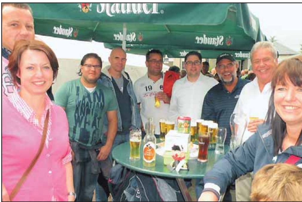
Pfarrfest St. Elisabeth, Schonnebeck