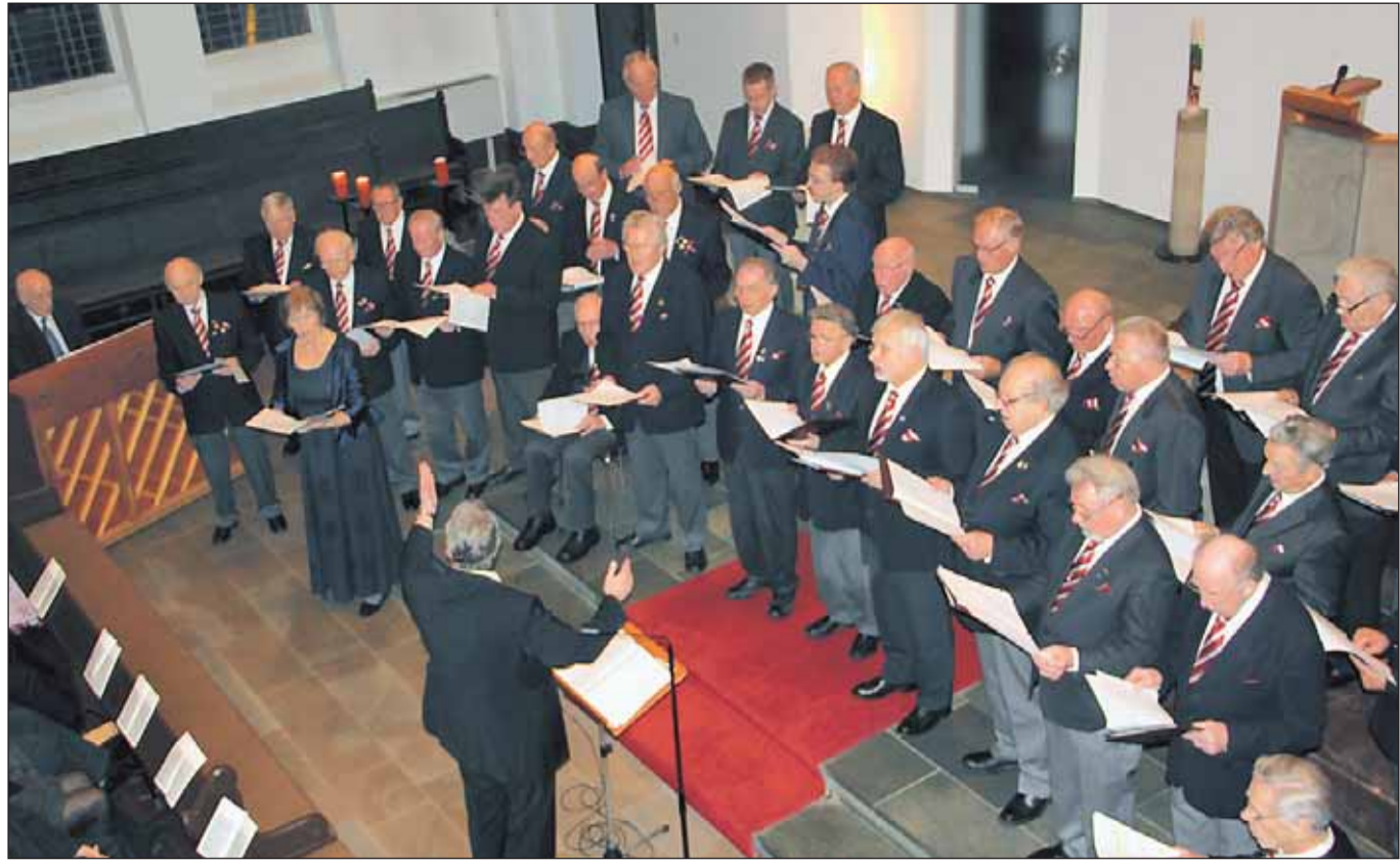
Die Sänger des MGV stimmten das Schonnebecker Publikum am dritten Adventssonntag auf das Weihnachtsfest ein.

keinerlei Verpflichtungen ein. Es ist auch keine Gründung eines Vereins, und alles ist kostenlos. Interessenten melden sich bitte unter tvschonnebeck@gmx.de Alle Anfragen werden dann von dort beantwortet. Öffentliche Einrichtungen, Veranstalter, Vereine, Gewerbetreibende oder Bürger können sich ab sofort auch unter Mail: tvschonnebeck@gmx.de melden, wenn sie sich mit einer Idee oder einer Veranstaltung auf „TV Schonnebeck“ an die Öffentlichkeit wenden möchten. – Peter Buers – Werbeblock Schonnebeck – Öffentlichkeitsarbeit.