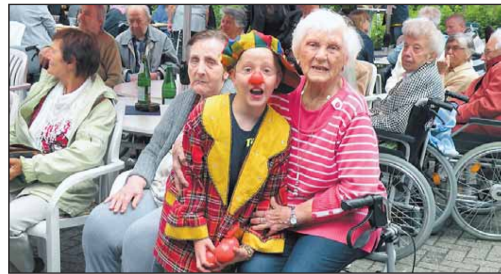
Sommerfest im Louise, Katernberg