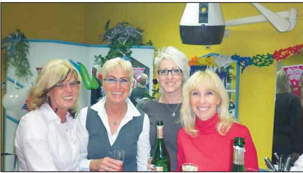
20 Jahre Salon Gierth, Schonnebeck