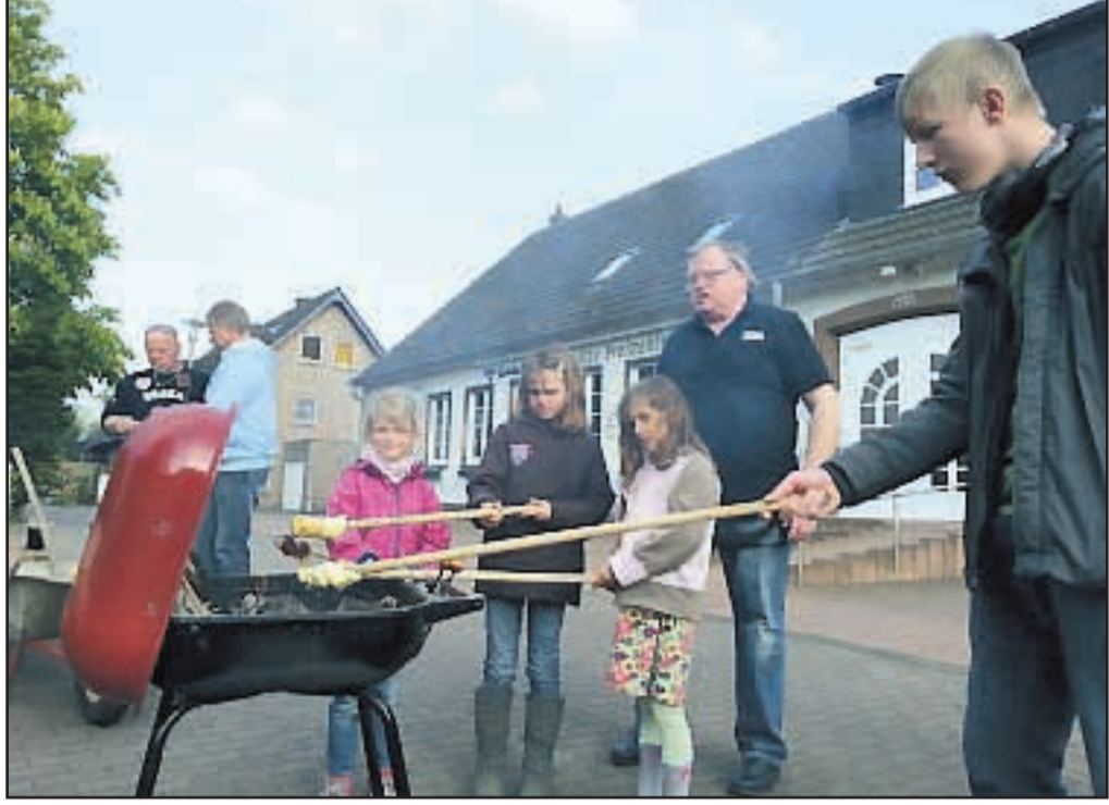
Die Kinder wären sicher enttäuscht gewesen, hätte es in diesem Jahr kein Stockbrot gegeben.

interessante Dankeschön-Angebote bereit. (Siehe Beispiele auf der Titelseite). Das Foto zeigt den großen hellen Trainingsraum mit hochmodernen medizinischen Geräten ein paar Tage vor der Eröffnung. Noch fehlte das schmückende Beiwerk und die Verkleidung der Klimaanlage.