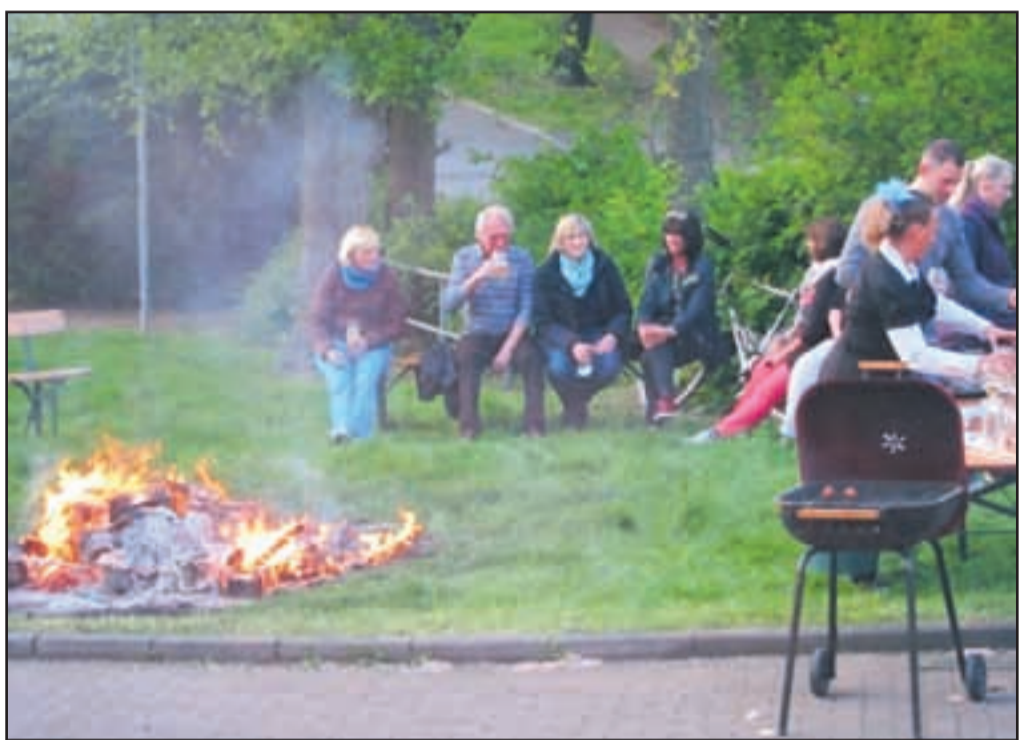
Die Gäste genossen die stimmungsvolle Atmosphäre und den Osterplausch auch bei kleiner Flamme.

triebs GmbH (EVB) wird am Freitag, dem 24. Mai 2014, zu einem Feierabendmarkt auf dem Schonnebecker Marktplatz eingeladen und zwar von 17.00 Uhr bis 22.00 Uhr. Der Feierabend- und Schlemmermarkt bietet frische und qualitativ hochwertige Lebensmittel, die teilweise direkt vom Erzeuger und aus biologischem Anbau stammen. Bei vielen Händlern können die Waren auch direkt vor Ort frisch zubereitet verspeist werden. Vor den Ständen laden Sitzgelegenheiten zum Verweilen ein. Ein Termin, den man sich merken sollte. Genauere Informationen folgen.