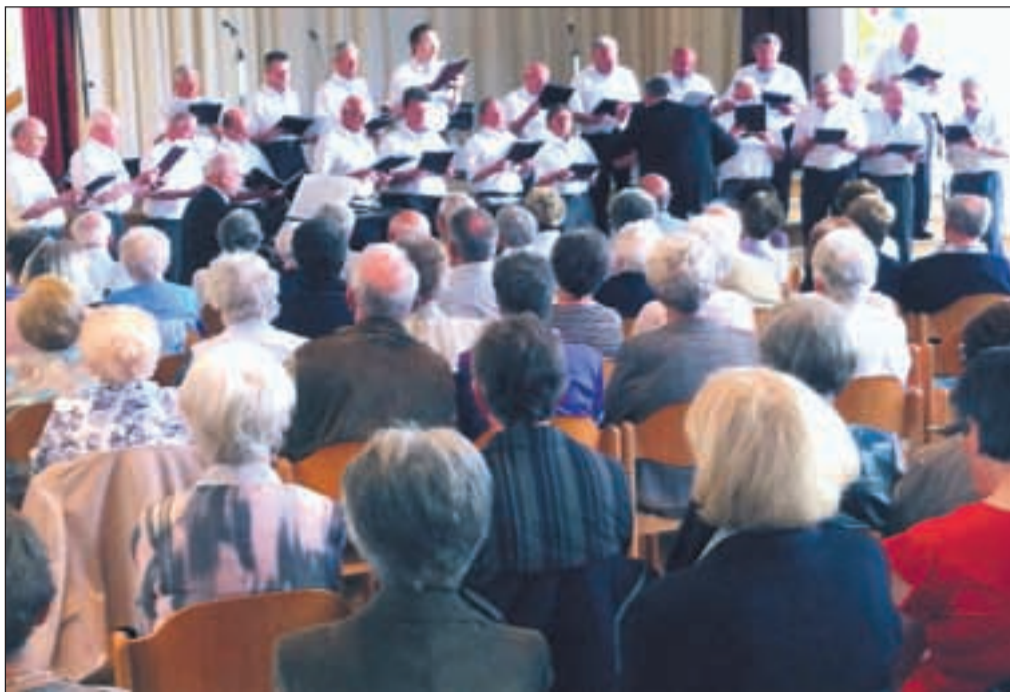
Die Konzerte des MGV 1897 Essen-Schonnebeck gleichen immer großen Familienfesten. Hier ein Eindruck aus dem Jahr 2013.