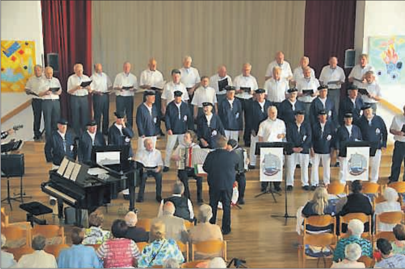
„Dankeschön und auf Wiedersehen“. MGV 1897 Essen-Schonnebeck gemeinsam mit dem „Marina Shanty Chor“ aus Oberhausen auf der Bühne des evangelischen Gemeindehauses in Schonnebeck. Unter http://youtu.be/CICx2eGTV6s kann man einige Ausschnitte aus dem Konzert sehen und hören.