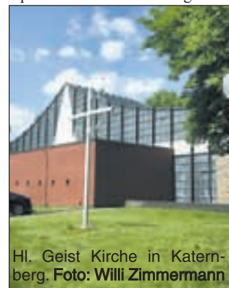
Hl. Geist Kirche in Katernberg.

Clönen, Essen und Trinken rund um Hl. Geist verschiedene Spielstände am Kindergarten