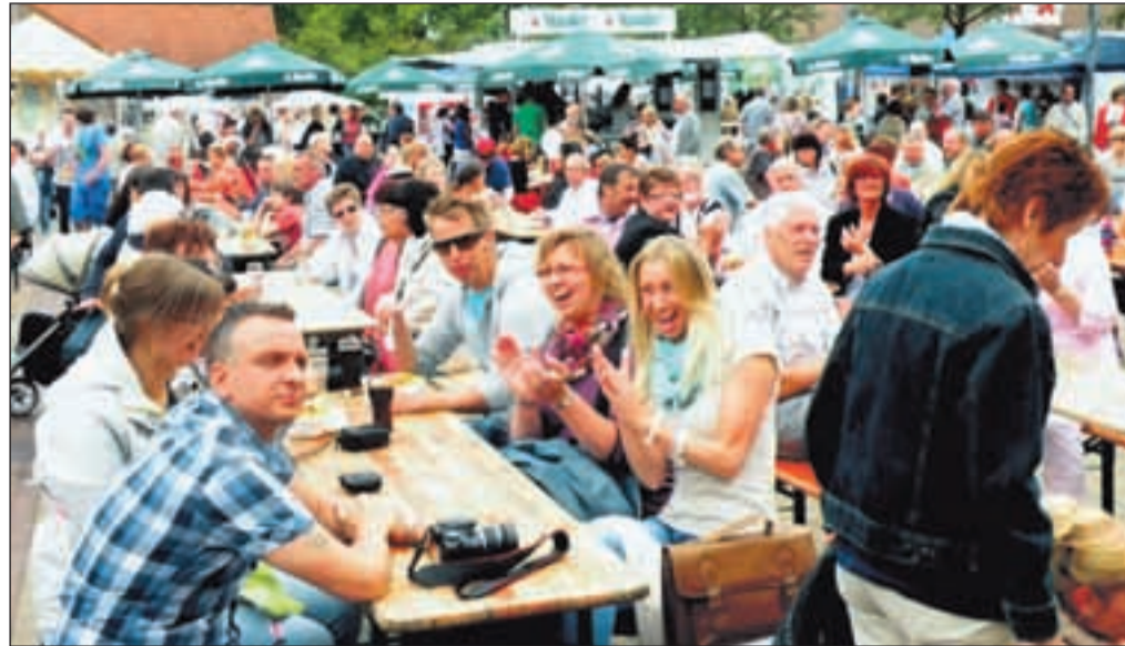
Nette, fröhliche Menschen auf dem Schonnebecker Marktfest 2013 – typisch!

18:00 Uhr Ziehung der Tombola-Hauptpreise - Ende