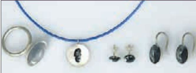
Eine Kollektion aus Silber mit echter Zollvereinkohle, welche teils innen feingoldet wurde. Auch wenn sich die Grundformen wiederholen, so bleibt doch jedes Stück ein Unikat.

Möbel, Filzobjekte, Taschen-, Textil- und Modedesign, Hutmode und Kreationen für Haus und Garten. Die „Butterzeit“ garantiert kulinarische Genüsse. Infos: www.schmuckprodukt.de., www.handverlesen-auf-zollverein.de