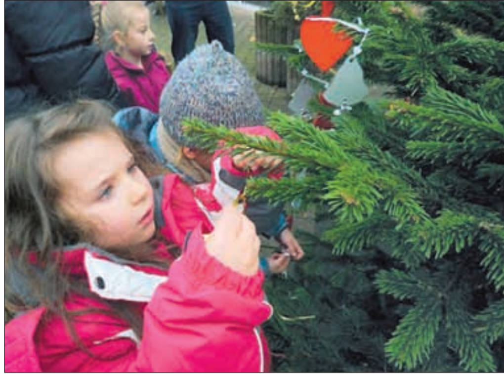
Christbaumschmücken macht besonders den Kleinen Spaß und trägt zur festlichen Stimmung in Schonnebeck bei.