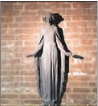
St. Barbara auf dem Denkmalpfad Zollverein.

Jedes Jahr am Barbaratag gibt die zweistündige Führung Einblicke in die Legende und das Brauch-