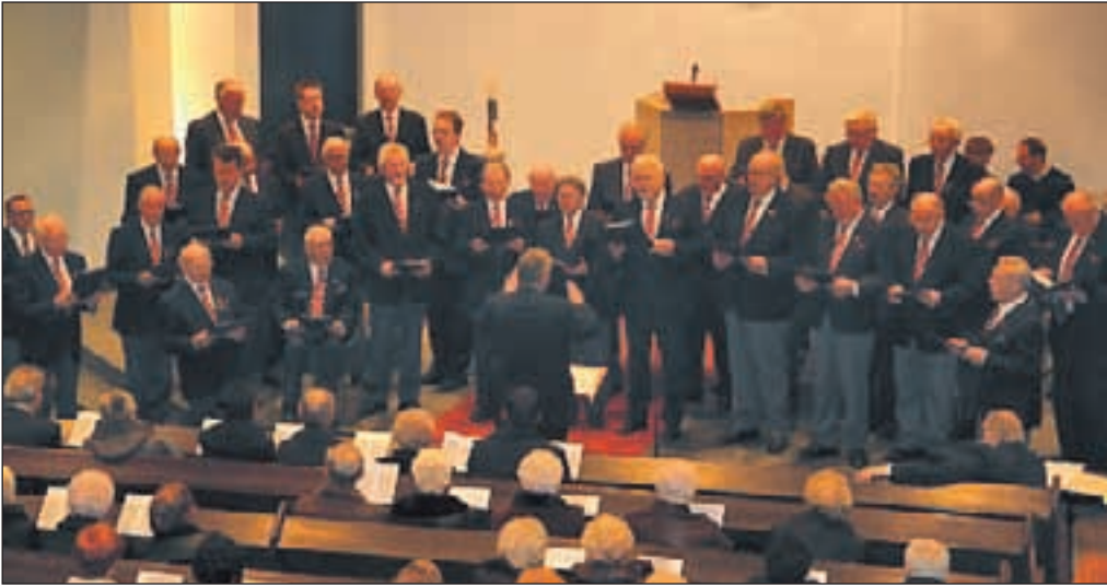
Der MGV 1897 bei seinem Weihnachtskonzert im vergangenen Jahr.