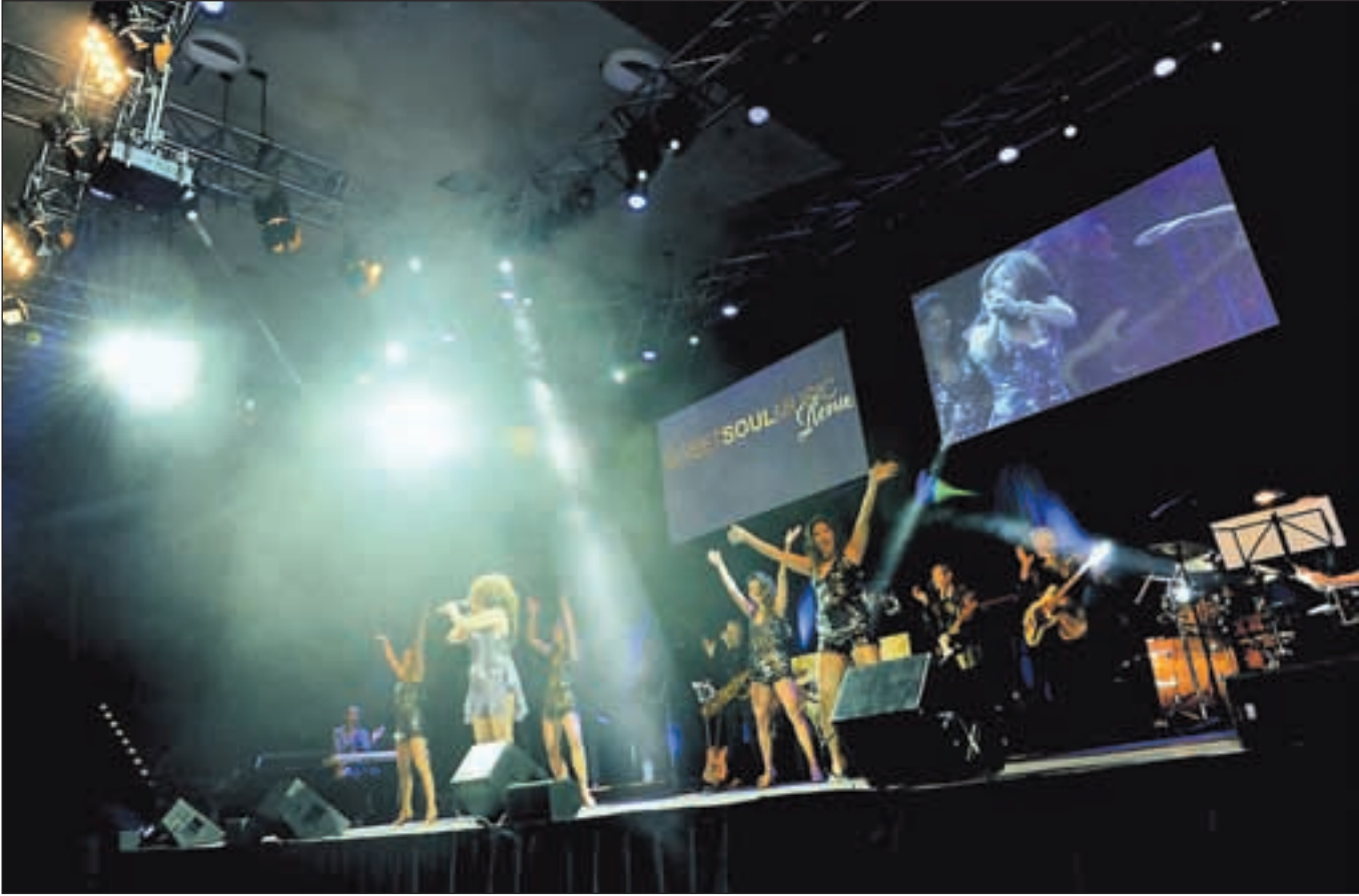
Ist sie es oder ist sie es nicht? Die feurige Interpretin der SweetSoulMusik – Gruppe und ihr Team kamen der großen Soul-Künstlerin Tina Turner verwechselbar nahe.