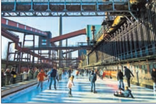
Laut dem Reisemagazin Marco Polo ist die Eisbahn auf Zollverein „der wohl faszinierendste Ort zum Schlittschuhlaufen bundesweit.“

können Firmengruppen das Eisstockschießen inklusive sportlicher Anleitung buchen. Am Wochenende sind dann Familien-, Freunde- oder Vereinstams mit jeweils bis zu zehn Personen an der Reihe. So bleibt den Schlittschuhläufern die große Eisbahn gänzlich überlassen. Besonders eindrucksvoll wird es nach Einbruch der Dunkelheit, wenn die Industriearchitektur in rotem und blauem Licht erstrahlt. Darüber hinaus wird auch die gastronomische Verpflegung erweitert: An verschiedenen Winterbuden gibt es Glühwein, Kakao und Leckereien.