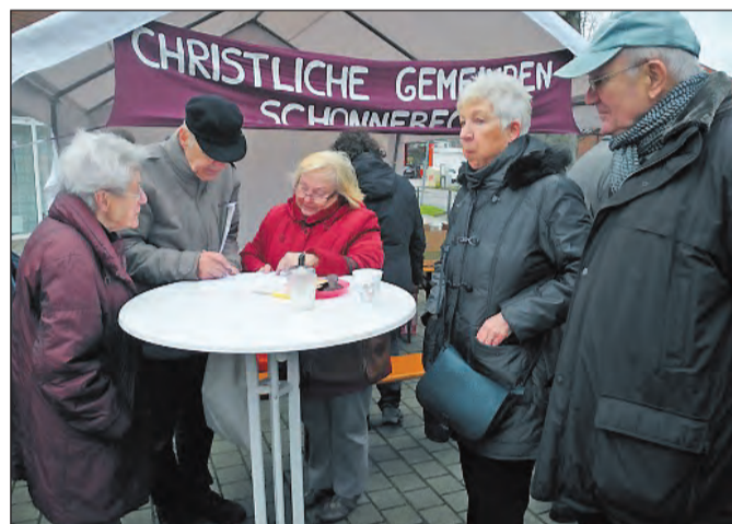
Rückblick auf die Weihnachtsaktion im vergangenen Jahr.

Schonnebeck. Wie in jedem Jahr treffen sich die Kirchengemeinden von Schonnebeck am letzten Samstag vor Weihnachten, also am 19. Dezember 2015, ab 10 Uhr auf dem Karl-Meyer-Platz. Eingestimmt von den weihnachtlichen Klängen des Posaunenchores und angeregt durch Kaffee und Glühwein wird die Frage „Warum feiern wir Weihnachten?“ den Besuchern gestellt. Wer sich auskennt, kann bei einem Rätsel mitmachen und mit etwas Glück eine kleinen Preis gewinnen. Auch wer sich beim Lösen des Rätsels nicht sicher ist, geht mit einem Weihnachtsgruß und der Weihnachtsgeschichte des Evangelisten Lukas nach Hause. Daheim kann man dann seine Weihnachtskenntnisse wieder auffrischen. Alle Bürgerinnen und Bürger sind zu der Weihnachtsaktion herzlich eingeladen. Die Initiatoren würden sich über eine rege Beteiligung sehr freuen.