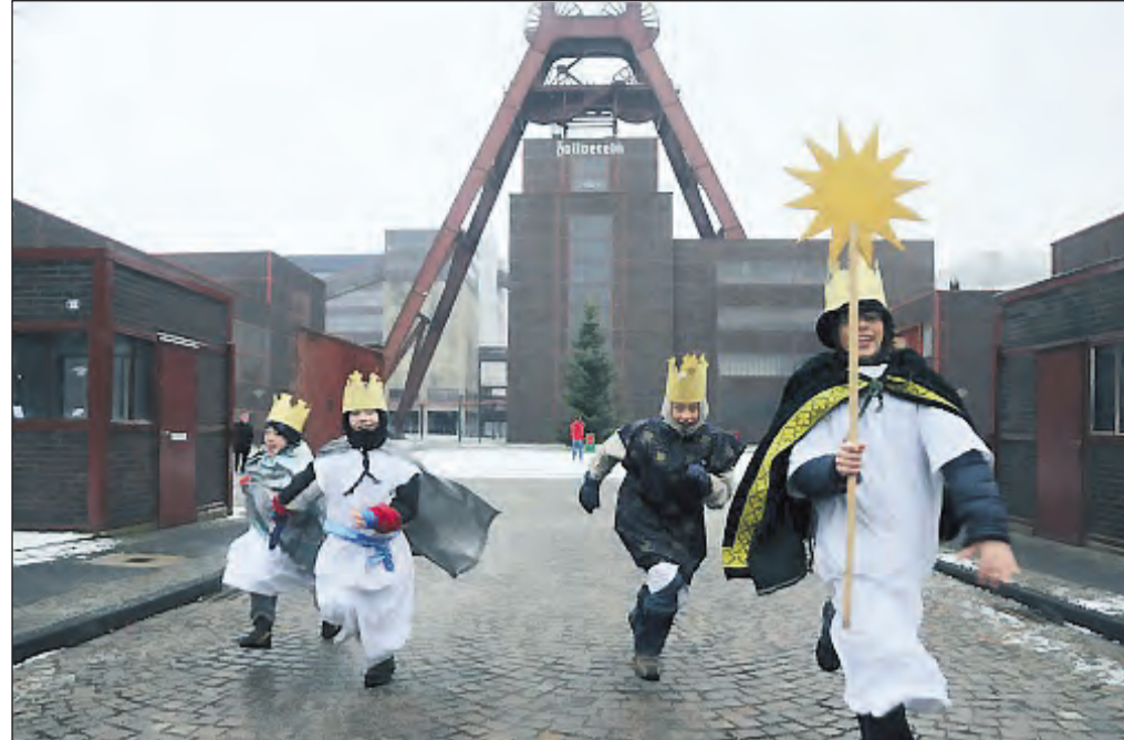
Sternsinger 2014 laufen sich warm.

Beachten Sie unsere Öffnungszeiten: Heiligabend und Silvester jeweils von 8.00 – 12.00 Uhr geöffnet (nur nach Vereinbarung) Samstag 2.1.2016 geschlossen