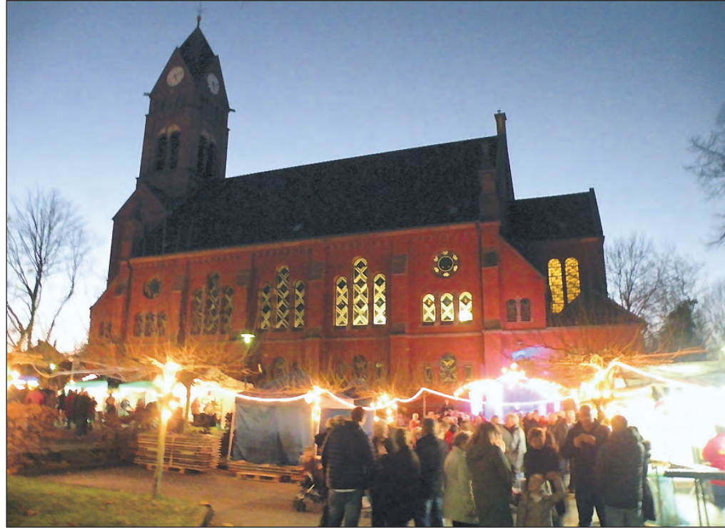
Der beeindruckende Platz am Fuße des Bergmannsdoms bestand seine Probe als Ort der Begegnung