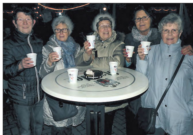
Katernbergerinnen als glühende Verehrerinnen des Nikolaus'