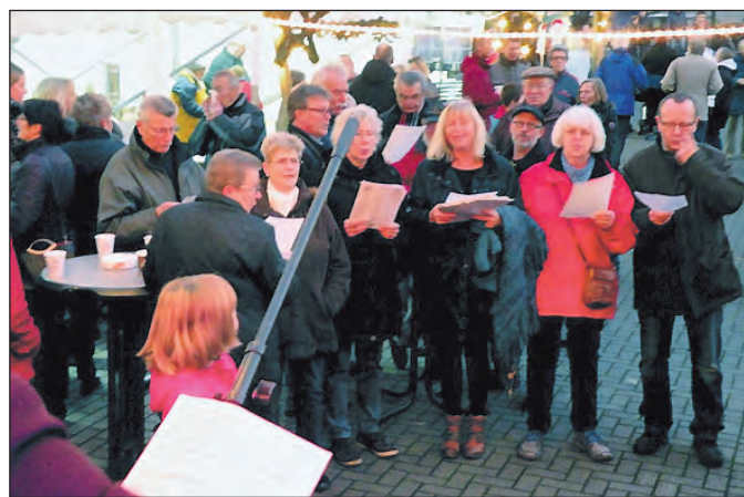
Offenes Singen in vorweihnachtlicher Atmosphäre