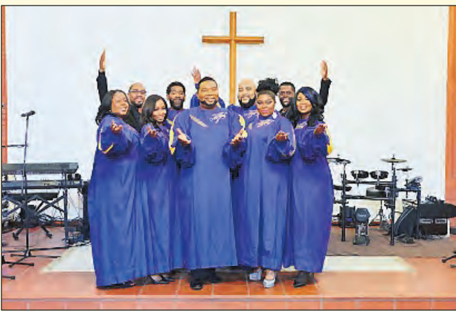
...die „New York Gospel Stars“ und