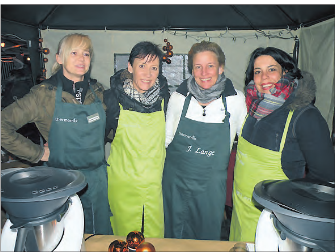
Das Vorwerk-Team demonstrierte die 12 Funktionen des Thermomix'