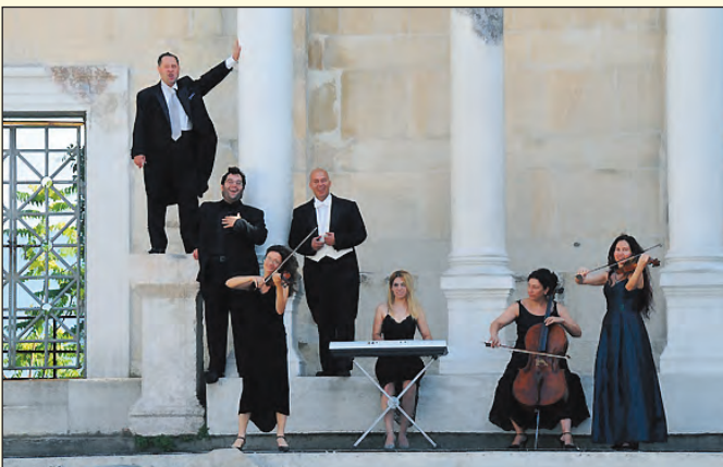
„Die himmlische Nacht der Tenöre“

im Bergmannsdom (s. Ankündigungen auf der Titelseite). Bitte senden Sie (für jede Veranstaltung getrennt) bis zum 19. Dezember eine Postkarte (bitte nur Postkarten, andere Einsendungen können wir nicht berücksichtigen) an den Wochenblatt-Verlag, Postfach 29 0173, 45318 Essen. Als Stichwort geben Sie bitte den Namen und das Datum der Veranstaltung an. Wichtig: Absender und Rufnummer nicht vergessen, damit wir Sie benachrichtigen können, falls Sie gewonnen haben. Unter den Karten entscheidet das Los, der Rechtsweg ist ausgeschlossen. Viel Glück!