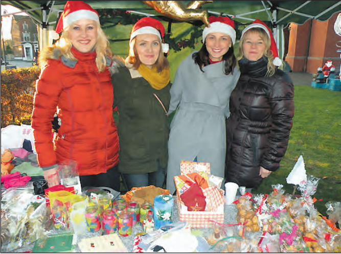
Gut gelaunt: Kindergarten Hl. Geist und Salon Alina