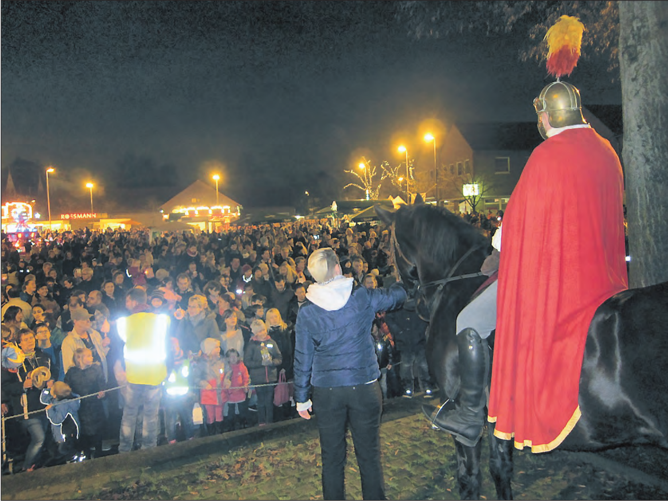
Jahr für Jahr findet sich eine große Fan-Gemeinde des Heiligen St. Martin auf dem Karl-Meyer-Platz in Schonnebeck ein, um mit ihm den musikalischen Abschluss des Martinstages zu feiern.