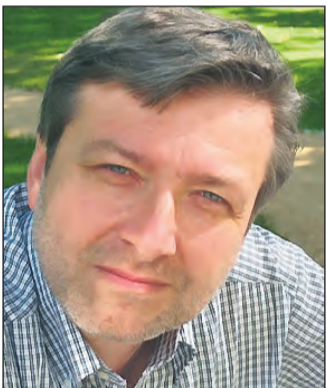
MdB Dirk Heidenblut

valistisches Rahmenprogramm. Wann: Freitag, 20. November 2015; Beginn: 20.11 Uhr; Wo: Ort: Foyer der Halle 12 auf Zollverein, Gelsenkirchener Straße 181.