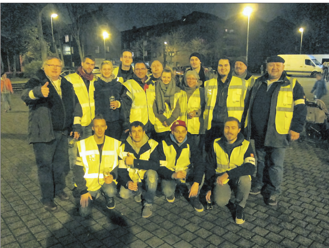
Den ehrenamtlichen Helfern des Martinsausschusses gilt ein besonders großer Dank. Ohne ihren Beistand wäre eine solche Großveranstaltung wie der Schonnebecker Martinszug gar nicht durchzuführen.