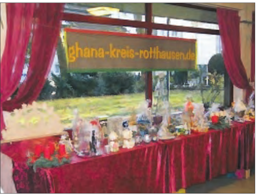
Ein Teil des Missionsbasars 2014.