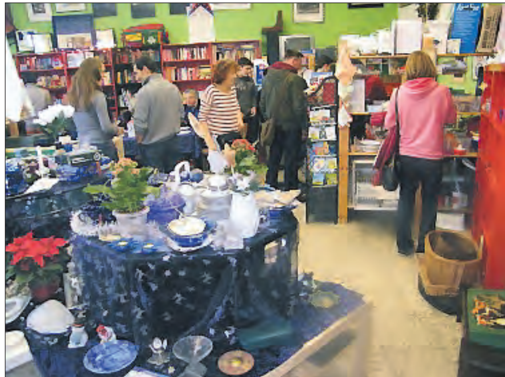
Der Weihnachtsbasar im Schülershop 2014 war gut besucht. Die Schülerinnen und Schüler hoffen, dass sich der Erfolg in diesem Jahr wiederholt. Foto/Bericht: Hans-Günter Iwanek