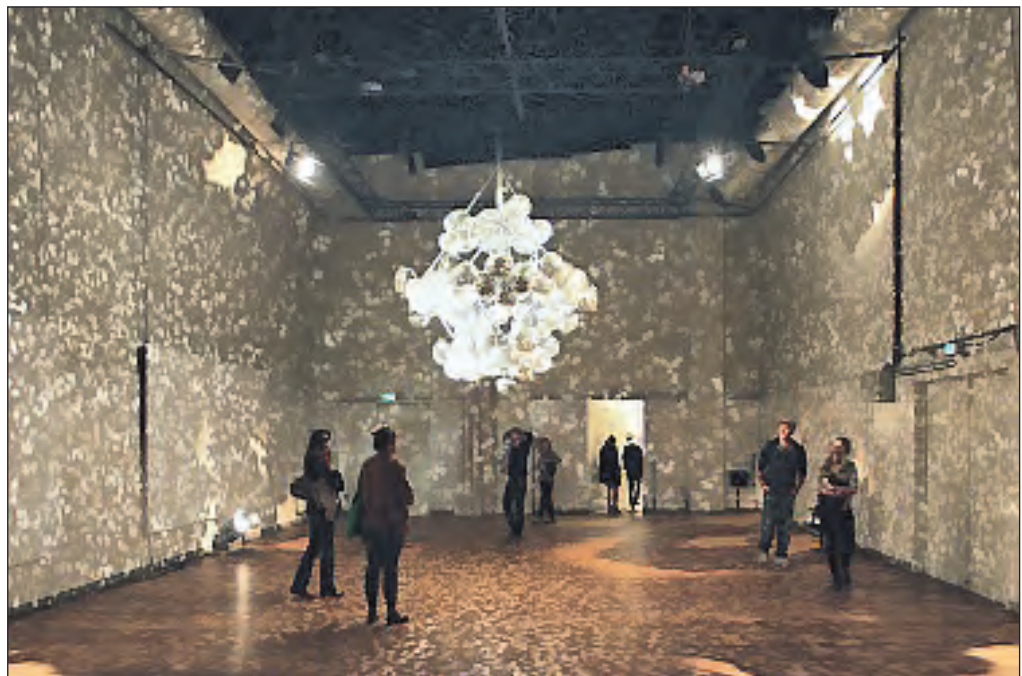
Kleine Bühne mit Kunstobjekt „Human Disco Bong“.