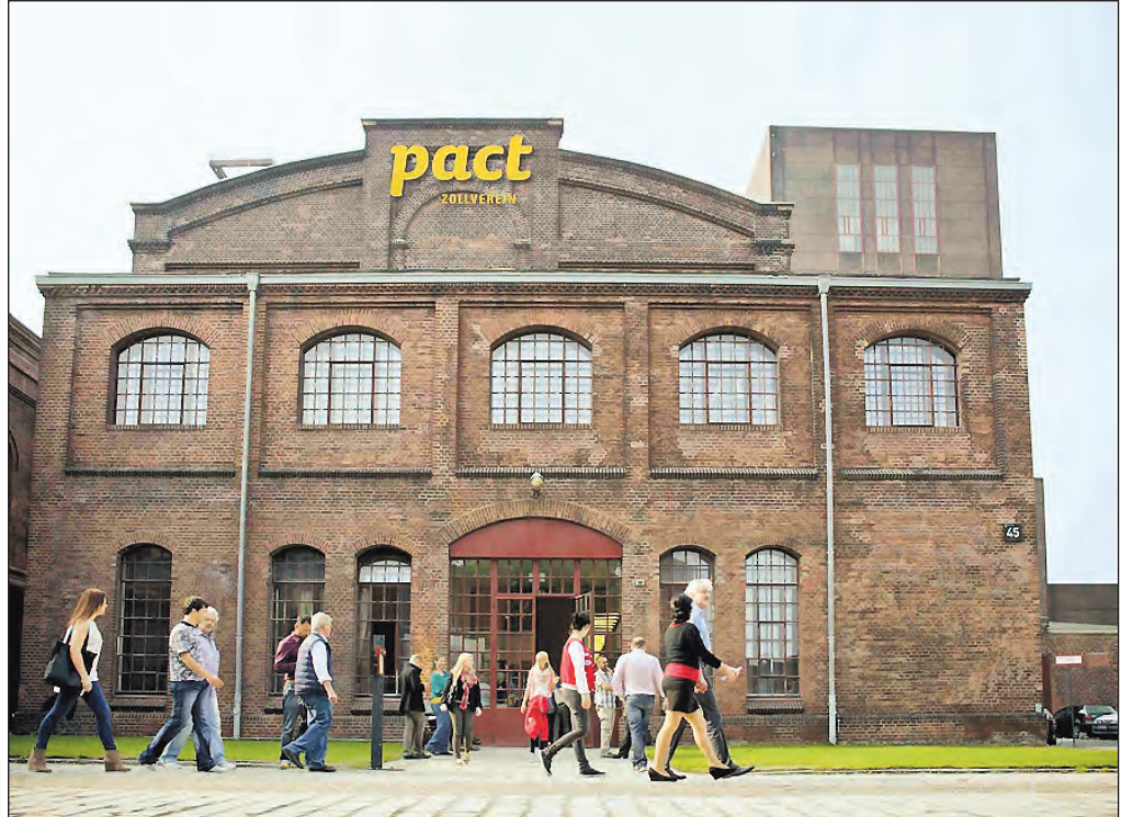
Außenansicht der ehemaligen Waschkau von Zollverein 1/2/8.