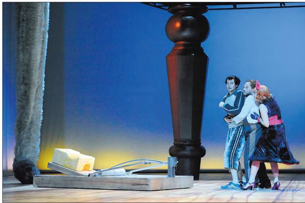
„Anton, das Mäusemusical“ wird 400 bedürftigen Kindern vor Weihnachten eine Freude bereiten.

Beleuchtung und vorweihnachtlicher Musik werden hoffentlich viele Besucher anziehen und zum Verweilen in netter Atmosphäre bewegen. Bürgerinnen, Bürger, Vereine, Verbände, Kindergärten und Schulen, die sich an dem Adventmarkt mit einem Stand oder Programmteil beteiligen möchten, sind herzlich willkommen. Mehr erfährt man von Herrn Risch, Gelsenkirchener Straße 10, Telefon 21 42 97 oder von Frau Reimann und Frau Geberzahn im Café Pauelsen, Gelsenkirchener Straße 8, Telefon 21 14 35.