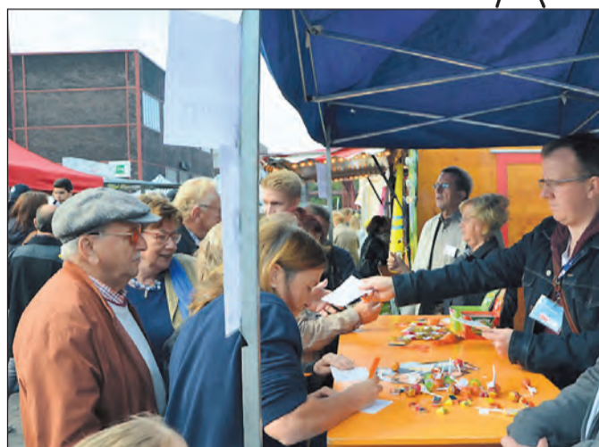
Große Resonanz: Mehr als 200 Bürger beteiligten sich an der Befragung der CDU Zollverein „Ihre Ideen für unsere Stadt“. Foto/Bericht: Franz B. Rempke

sein letztes Konzert als Dirigent mit diesem Auswahlblasorchester geben. Ort der Veranstaltung ist die Christuskirche der EFG Essen-Schonnebeck, Gareisstraße 41. Der Eintritt ist kostenlos.