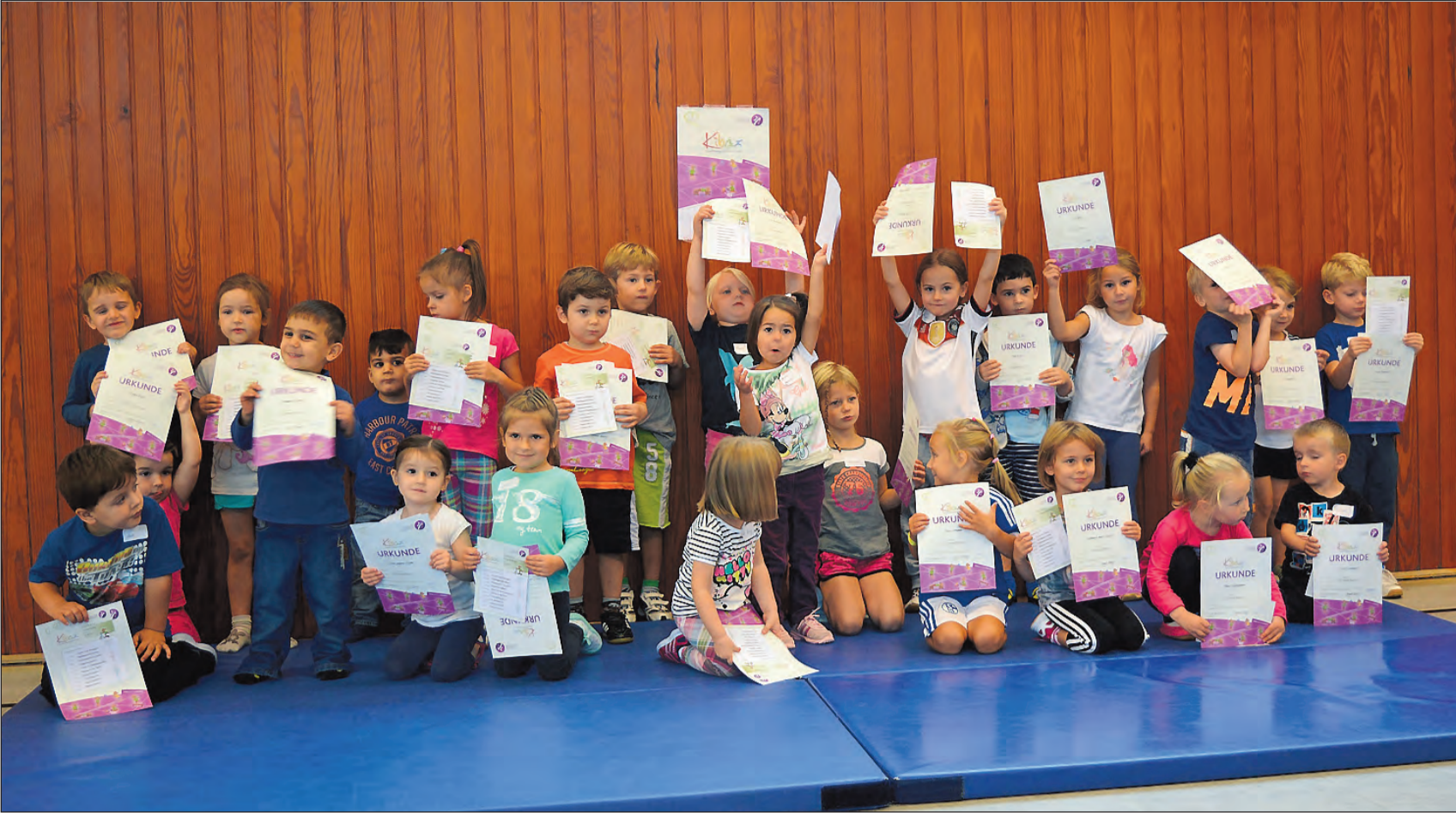
Geschafft! So sehen Sieger aus, denn gewonnen haben sie alle. Voller Stolz zeigen die kleinen Sportler, mit sich und ihrem Erfolg zufrieden, am Ende das begehrte Dokument: Urkunden und Laufkarten.