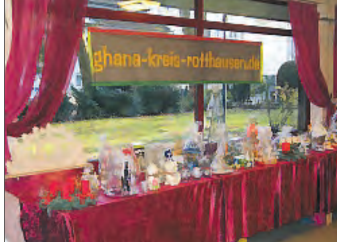
Ein Teil des Missionsbasars 2014.

und gleichzeitig Preise im Gesamtwert von über 2.500 Euro gewinnen zu können. Hinter jedem Türchen des Adventskalenders verstecken sich attraktive Gewinne in Form von Gutscheinen oder Sachpreisen. Die Gewinnnummern werden ab dem 1. Dezember 2015 täglich u.a. auf www.jugendwerk-essen.de und auf der Facebook-Seite 'Jugendwerk der AWO Essen' veröffentlicht. Stimmt die, an einem bestimmten Tag veröffentlichte Nummer mit der eigenen Nummer des Adventskalenders überein, so hat man einen der Preise hinter dem Türchen dieses Tages gewonnen.