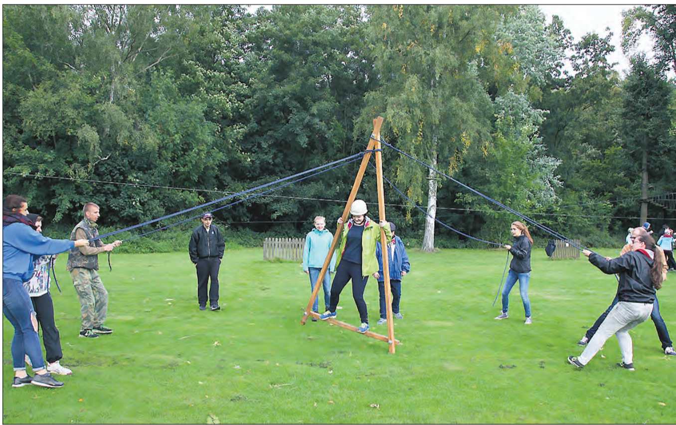
„Teambuilding“ war ein Ziel des Triangellaufs.

Zum Fest „Allerseelen“ am Montag, dem 2. November lädt die Kolpingfamilie um 18.30 Uhr zur Abendmesse in St. Joseph ein. Im religiösen Gespräch um 19.00 Uhr im Gemeindezentrum geht es um den christlichen Umgang mit dem Tod „Asche zu Asche – Staub zu Staub“. Gäste sind wie immer willkommen.