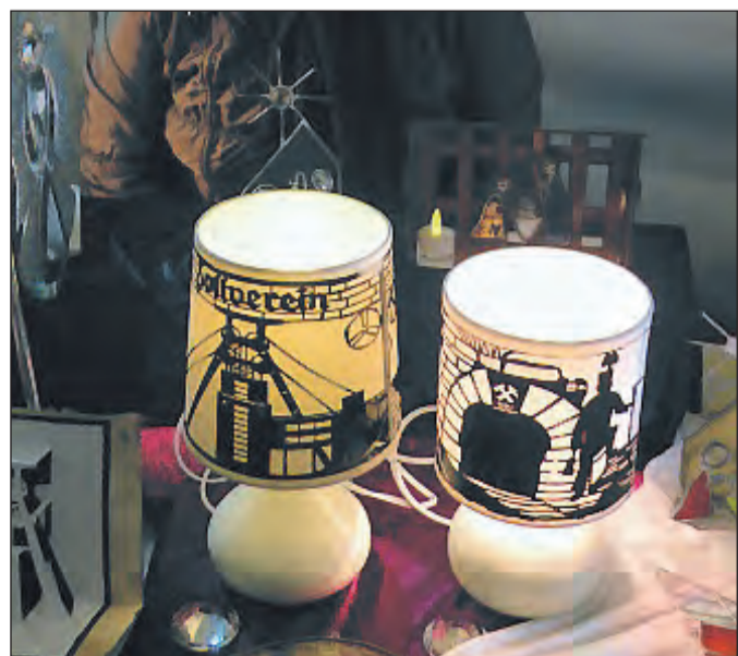
Viele hübsche Dinge werden sicher wieder auf dem Nikolausmarkt angeboten. Foto von 2014: Willi Zimmermann

Kindergärten, Schulen, Gewerbetreibende und andere Interessenten, die sich mit einem Stand beteiligen oder etwas zum Programm beitragen möchten, sollten sich möglichst kurzfristig beim Katernberger Werbering melden. Kontakt: Werbering - Geschäftsführer Dieter Sundermeier, Essen Katernberg, Katernberger Straße