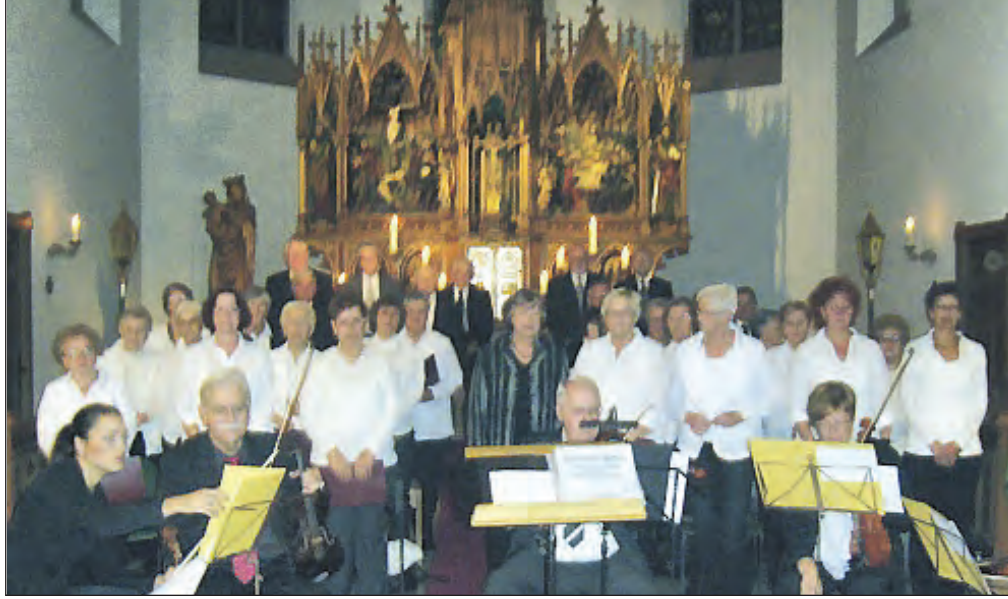
Die Chorgemeinschaft St. Joseph feiert am kommenden Samstag, 24. Oktober 2015, ihr Stiftungsfest.