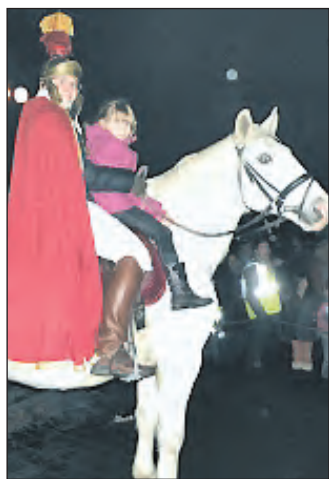
St. Martin 2013

St. Martin wird in diesem Jahr wieder, begleitet von hoffentlich zahlreichen seiner großen und kleinen Verehrerinnen und Verehrer, zum 67. Mal durch Schon-