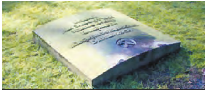
Die Grabstätte befindet sich auf dem östlichen Teil des Friedhofes und ist mit einer Denkmalplatte abgedeckt.

Mitleidenschaft gezogen. Die Beisetzung der Opfer auf dem Rotthausener Friedhof an der Hilgenboomstraße fand am 7. August unter großer Anteilnahme der Bevölkerung nach einer vorausgegangenen Trauerfeier auf Schacht 8 statt. Anwesend waren Bundespräsident Prof. Theodor Heuß und Landtagspräsident NRW Gockeln. Die Grabstätte befindet sich auf dem östlichen Teil des Friedhofes und ist mit einer Denkmalplatte abgedeckt. Text aus: Rabas/Bergbausammlung/Grubenunglücke Dahlbusch