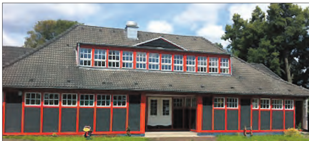
Die Jugendhalle Schonnebeck, seit 100 Jahren ein Ort der Bewegung und Entspannung.