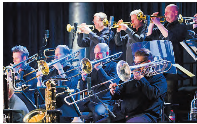
Die WDR Big Band eröffnet im September das zweite Halbjahr der Zollverein-Konzerte.

angepasst, wo er sie unmittelbar vor Publikum aufführt. Auch die begehbare Installation für Laser, Nebel und Lautsprecher „Werk III“ hat Henke ganz auf den Raum ausgerichtet. Der Künstler ergänzt die zwölf Betontrichter der Mischanlage durch Pyramiden aus Laserstrahlen und hüllt sie in Nebel, während versteckte Lautsprecher komplexe Klangwelten erzeugen. Die begehbare Installation ist vom 6. bis zum 29. November geöffnet. Am 4. Dezember um 20.00 Uhr läutet das ChorWerk Ruhr mit „Vom Himmel hoch...“ im ehemaligen Salzlager auf der Kokerei die Weihnachtssaison ein. Unter der musikalischen Leitung von Klaas Stok präsentiert das ChorWerk Ruhr a capella Chormusik von der Renaissance bis zur Gegenwart. Einen Jahresrückblick mit Augenzwinkern verspricht schließlich die große WDR 5 Kabarett-Show 2015 am 10. Dezember um 20.00 Uhr in der Halle 12. Infos 24 6810 oder www.zollverein.de