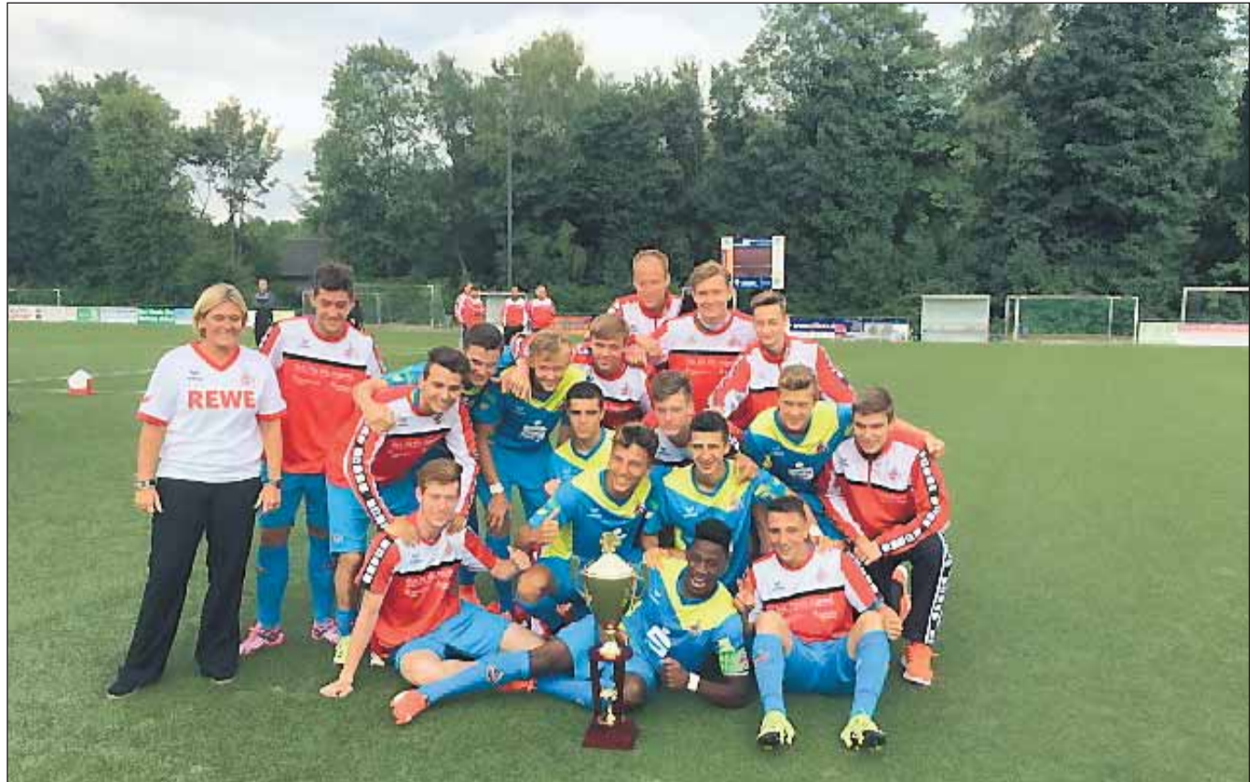
Den im Wochenblatt angekündigten PRIMEX Steel Trading U 19-Cup vom vergangenen Wochenende (18/19. Juli 2015) am Schetters Busch gewann nach einem spannenden Turnier die Mannschaft des 1. FC Köln im Endspiel gegen Rot-Weiss Essen mit 1:0. (mehr in der nächsten Ausgabe).