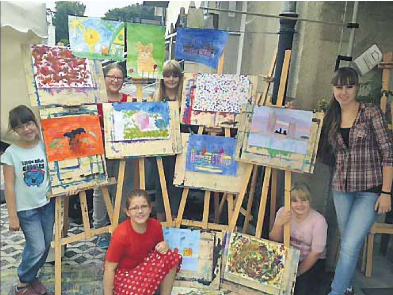
Junge Künstlerinnen mit ihren Werken im Atelier Susanne Nocke.