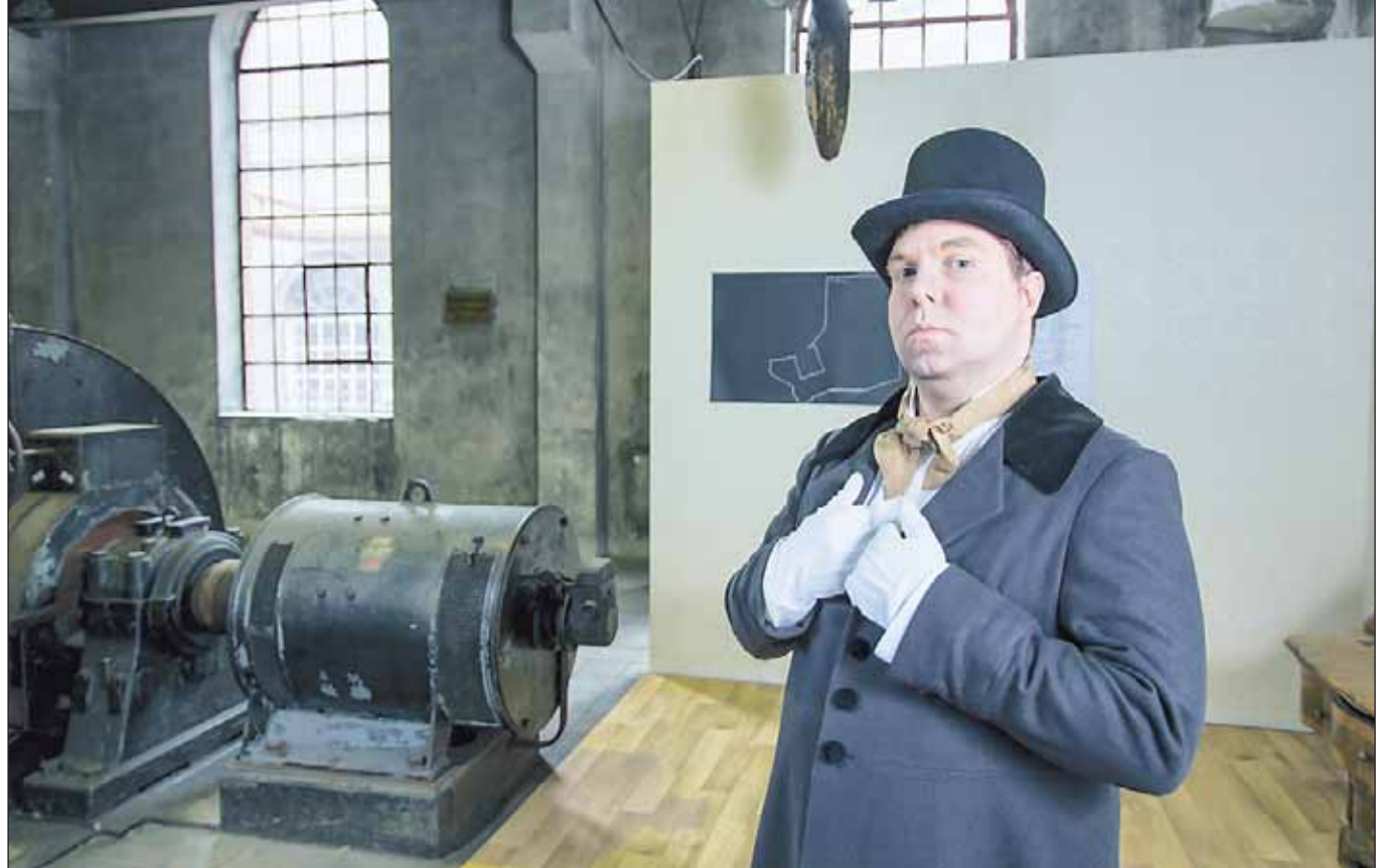
Am Originalschauplatz begegnen die Teilnehmer sieben historischen und fiktiven Persönlichkeiten der Zechengeschichte.

Gelsenfinanz Karl-Meyer-Str. 34, 45884 Gelsenkirchen Tel. 0209/177 87 44 Fax 0209/ 177 87 43