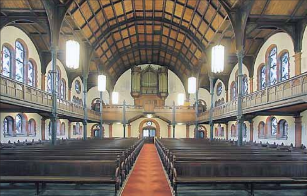
Der Bergmannsdome in Katernberg ist schon seit langem ein überregional anerkannter und exzellenter Konzert- und Veranstaltungsort.