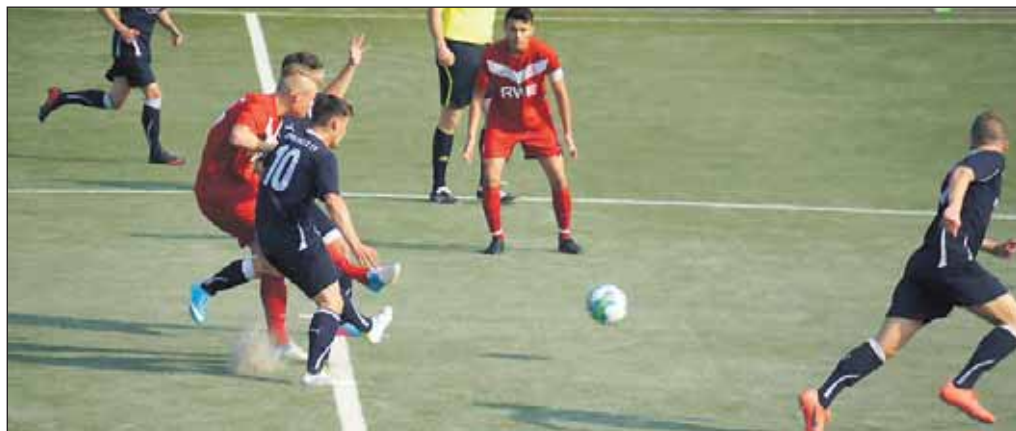
Eine Spielszene von 2013 zwischen Rot-Weiss Essen und dem Wuppertaler SV.