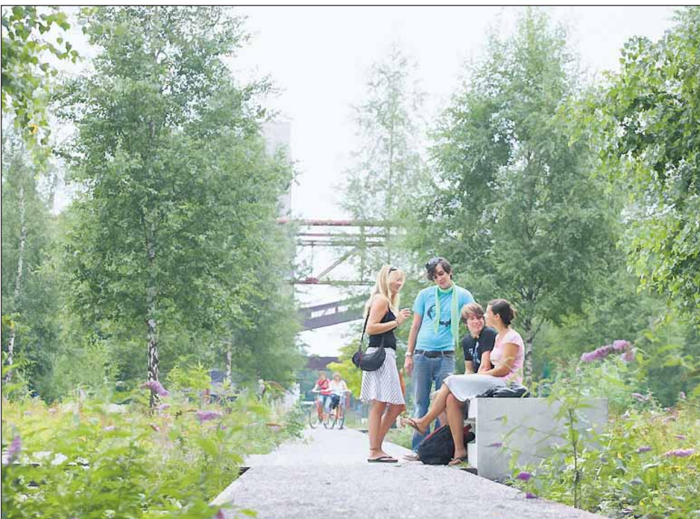
Die Halde lebt! Frösche, Flechten, Fledermäuse oder Fliederspeer: Auf dem UNESCO-Welterbe Zollverein in Essen tummeln sich über 540 Farn- und Blütenpflanzenarten sowie viele Tierarten, die Besucher bei einem Spaziergang durch die Industrienatur entdecken können. Die soeben veröffentlichte neue und kostenlose Wanderkarte „Natur auf Zollverein“ erklärt an zwölf Stationen anschaulich die Besonderheiten der Natur auf dem Welterbe.