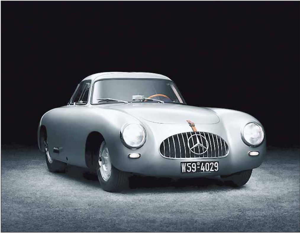
Ein Star unter den Exponaten der Ausstellung in Halle 5: Mercedes-Benz 300 SL Rennsportwagen als formschön 1955 ausgezeichnet

Norman Foster umgebauten Kesselhaus auf Zollverein. Seit 1997 beherbergt es mit rund 2.000 Exponaten die weltgrößte Ausstellung zeitgenössischen Designs. In einem zweiten Teil wird die Geschichte der Ausstellungen und der Wettbewerbe des Design Zentrums sowie die Entwicklung seines Corporate Designs in Zusammenarbeit mit führenden Fotografen und Grafikdesignern dokumentiert und verdeutlicht, welchen internationalen Stellenwert der Red Dot heute in der Designwelt besitzt. Eine gemeinsame Ausstellung von Ruhr Museum und Red Dot Design Museum Öffnungszeiten: Mo - So: 10 - 18 Uhr; Ausstellungsort: UNESCO-Welterbe Zollverein Areal A [Schacht XII], Halle 5 [A5], Gelsenkirchener Straße 181, 45309 Essen. Eintritt: Regulär: 5 Euro; Ermäßigt: 3 Euro Kinder und Jugendliche unter 18 Jahren: frei; Informationen: www.red-dot-design-museum.de und www.ruhr-museum.de