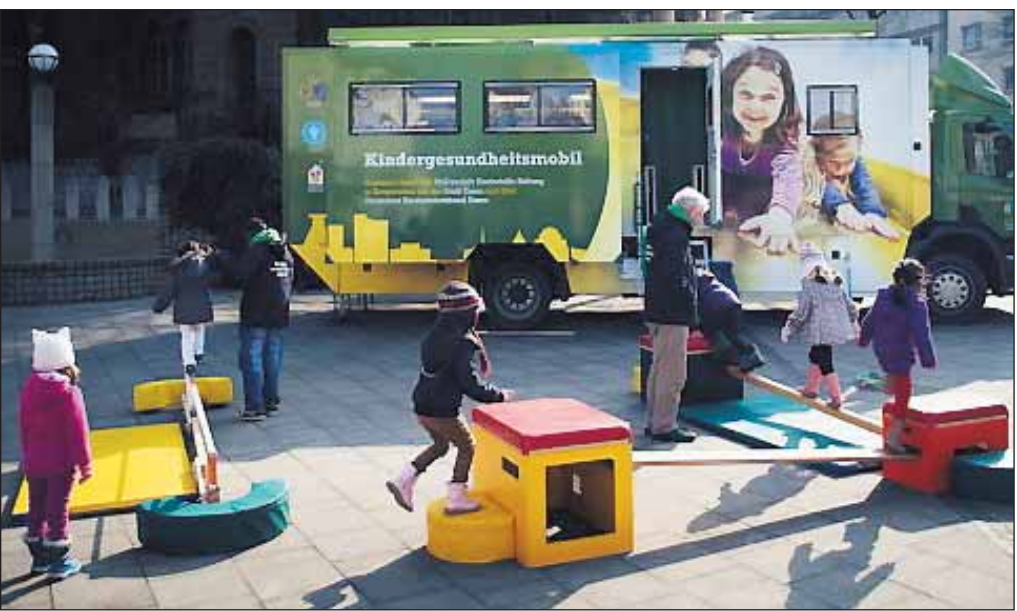
Allein 2014 verzeichnete das Kindergesundheitsmobil 9.573 Besucher. Nun wurde das Projekt bis März 2017 verlängert.