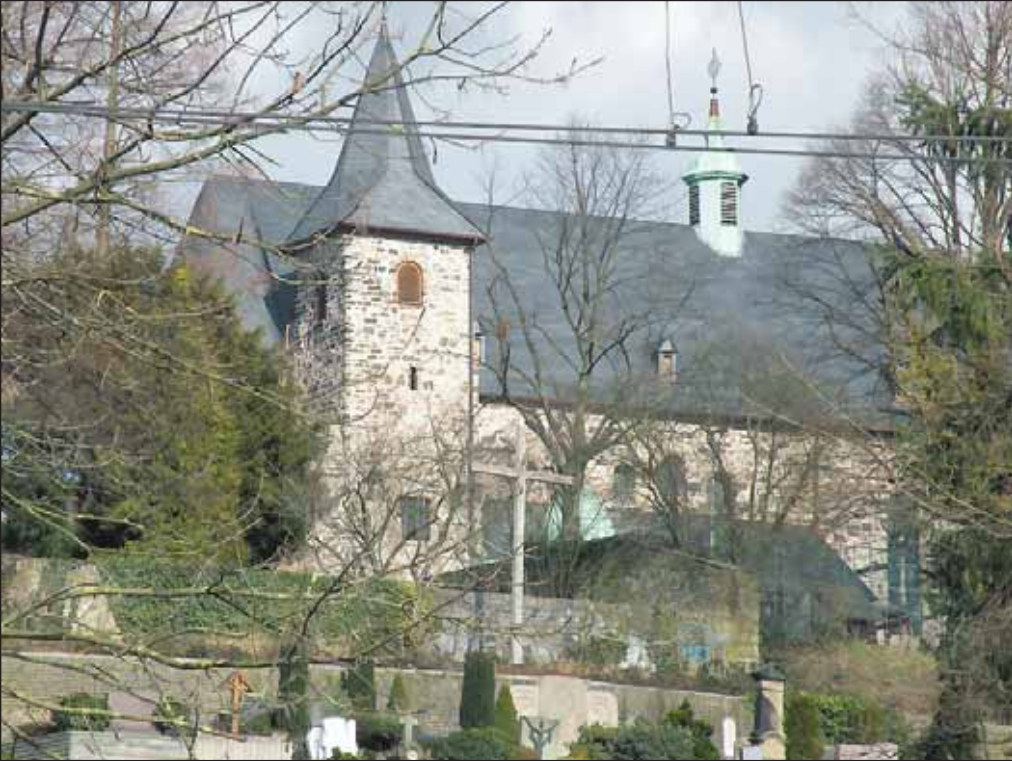
Die Stiftskirche in Stoppenberg, Ziel der Atempause-Radtour am 19. Juli 2015