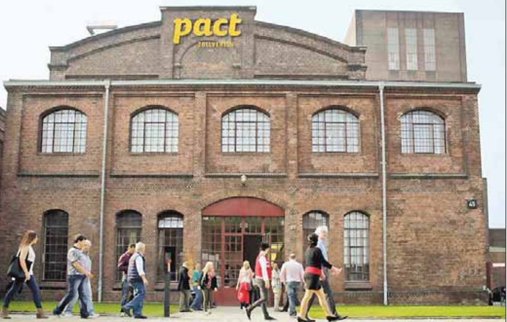
PACT Zollverein in der ehemaligen Waschkau auf Zollverein wurde in diesem Jahr als „Ort des Fortschritts“ ausgezeichnet.