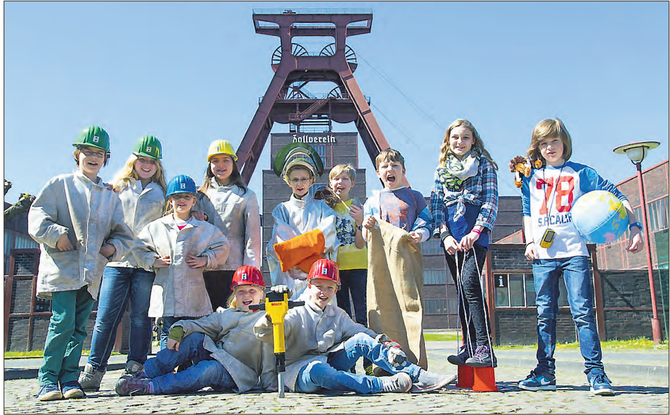
Sie freuen sich auf eine spannende Ferien-Zeit auf dem Welterbe Zollverein.

Familien erhalten auf den Gesamtpreis 5 Euro Rabatt (ab 3 Personen) Treffpunkt: Schalker Straße gegenüber der Moschee 8.30 Uhr / Abfahrt 9.00 Uhr Zurück in Essen : ca. 18.00 - 18.30 Uhr. Bitte schnell anmelden.