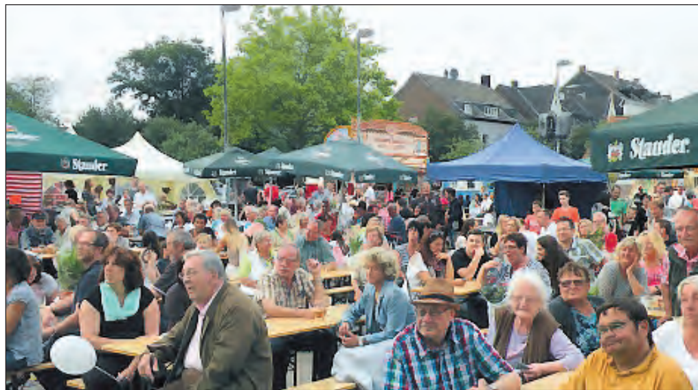
Zwei schöne Tage erlebten die Menschen aus Schonnebeck und Umgebung auf dem Karl-Meyer-Platz.

Semmer - Sonne - Superstimmung... (mehr auf Seite 3)