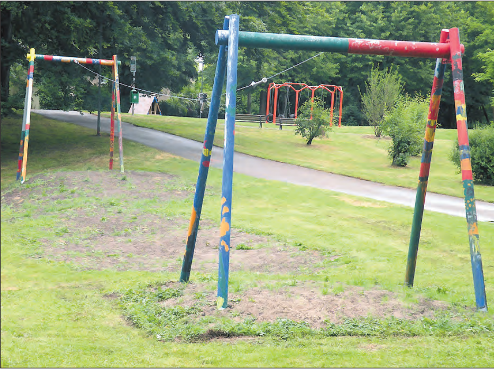
Die neue Seilbahn im Ophoff-Park, zum Zeitpunkt der Aufnahme nur ein Stilleben, steht für seine Nutzer bereit.