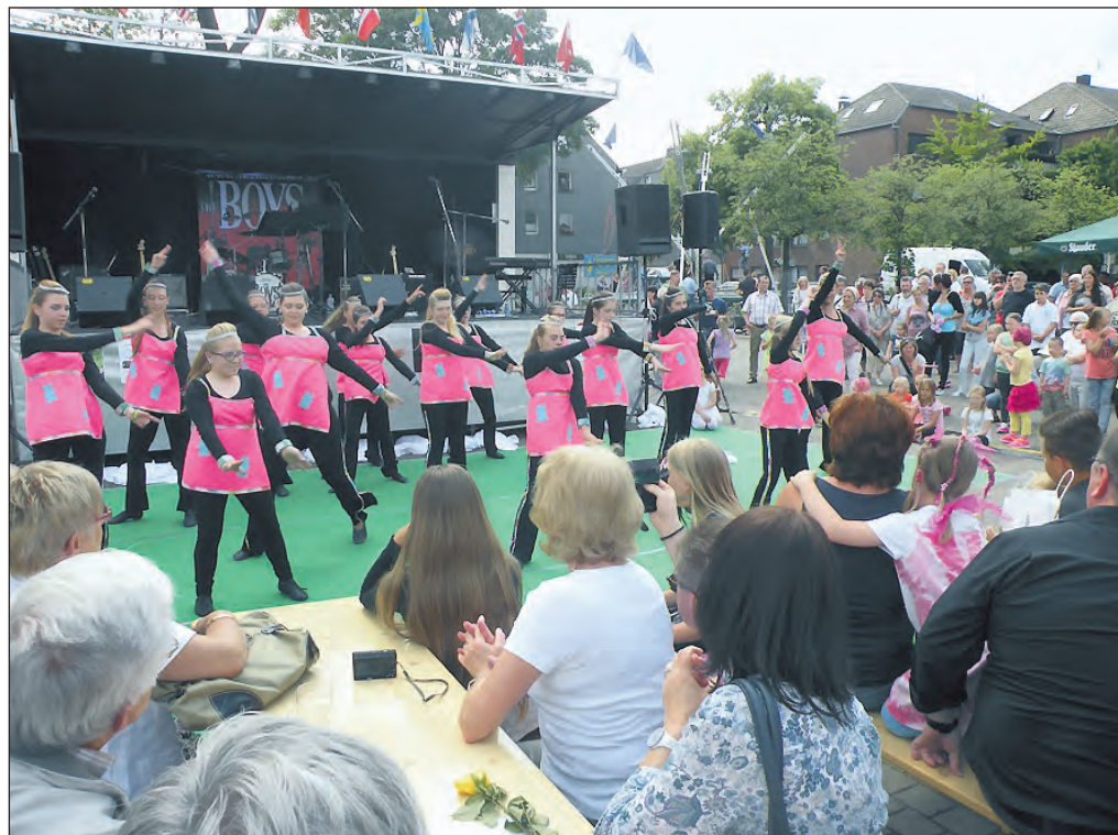
Die Tanzgarde der „KG Närrische Elf“ erfreute die Besucher des Marktfestes mit Schwung und Perfektion.