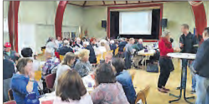
Exakt 91 Teilnehmer trugen sich auf der Katernberg-Konferenz am 21. Juni 2015 in die Anwesenheitsliste ein.