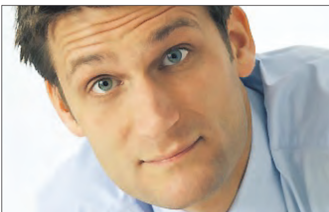
Kabarettist Christian Ehring.

Eintritt kostet 18 Euro, ermäßigt 10 Euro, jeweils zuzüglich Systemgebühr. Karten sind im Vorverkauf erhältlich unter Fon +49 201 8122-200, tickets@theater-essen.de, www.imvorverkauf.de, im Ticket-Center der Theater und Philharmonie Essen sowie im RUHR.VISITORCENTER Essen und an allen Vorverkaufsstellen über CTS. Die Reihe ZOLLVEREIN Konzerte bringt im ersten Halbjahr 2015 ein hochkarätiges Programm mit einer ausgewählten Mischung aus Jazz, Klassik, Chormusik, Kabarett und experimenteller Musik auf dem Welterbe.