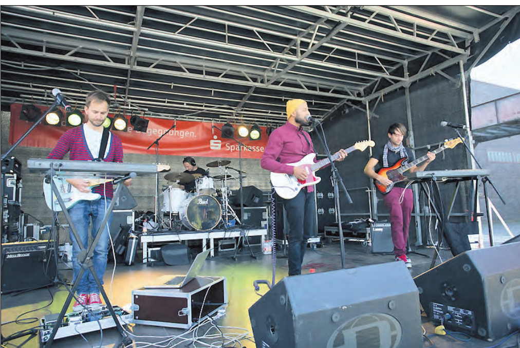
Das Bild zeigt die Band „Echofuchs“.

Stoppenberg/Frillendorf. „Komm, lieber Mai, und mache“ lautet die musikalische Überschrift für ein Treffen, zu dem der Frauenkreis der Evangelischen Thomasmgemeinde für kommenden Donnerstag, den 30. April, von 9.15 bis 11.30 Uhr ins Gemeindezentrum am Erlenkampsweg 2 einlädt. In fröhlicher Runde wollen die Gäste Frühliedern anstimmen und dem einen oder anderen Frühliedgedicht lauschen.