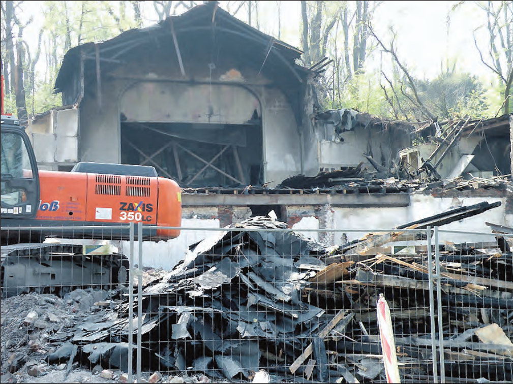
Der Abriss der Brandruine geht voran – Stand 24.4. 2015.