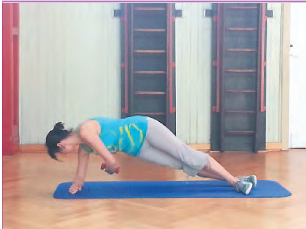
Sandra Brencher beim funktionellen Training.