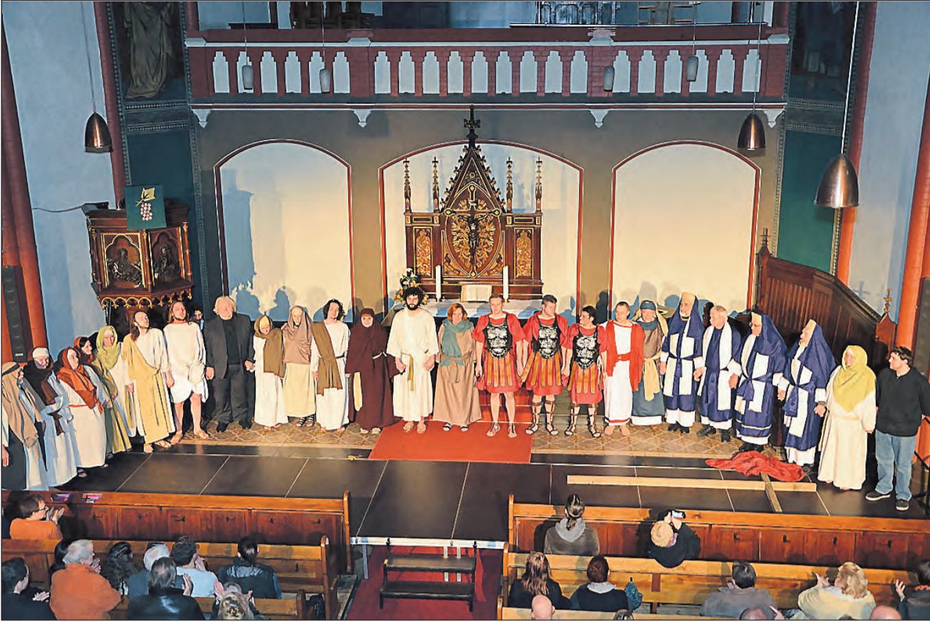
Das Ensemble in der Evangelischen Kirche an der Steeler Straße in Rotthausen ist mit Leidenschaft dabei.