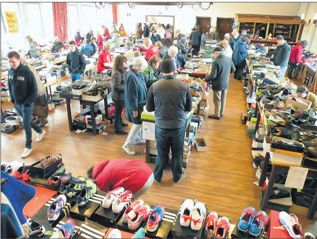
Das Kolpinghaus Rotthausen, Karl-Meyer-Straße 42/Ecke Steeler Straße, hier ein Foto aus 2012, ist seit langem eine ausgewählt gute Adresse für den Verkauf günstiger Marken-Schuhe und -Textilien.