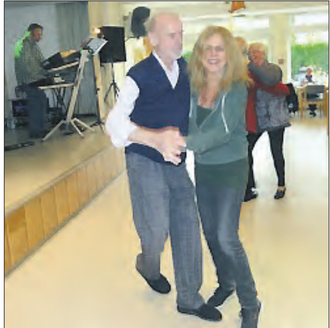
Tanzen hält jung!

Hauptversammlung des TuS Katernberg Volleyball. Die diesjährige Hauptversammlung findet am Freitag, dem 13. Februar um 19.00 Uhr in der Gaststätte Reiterhof Liefke in Katernberg, Am Reiterhof 28 statt. Wegen der anstehenden Neuwahlen und dem Kassenbericht bittet der Vorstand alle Mitglieder um ihre Teilnahme.