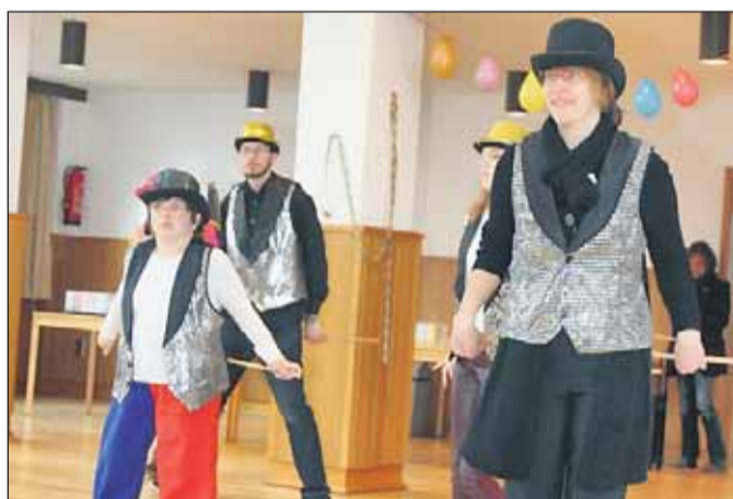
Tanzgruppe der GSE