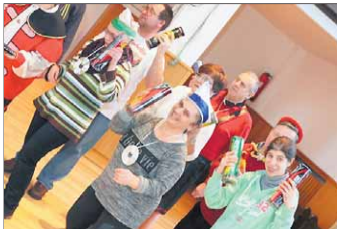
Rhythmus durch Dosen beim Samba

ins Leben gerufen und viele Jahre betreut (Wochenblatt berichtete mehrfach). Einmal im Monat treffen sich hier rund 60 Menschen mit Behinderungen aus den unterschiedlichsten Kontexten.