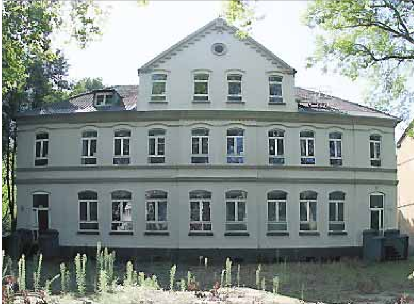
Die gute alte Hilgenboomschule ist für Rotthausen von großem städtebaulichen Wert und bleibt dem Stadtteil erhalten.