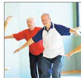
Bewegungssicherheit im Alltag üben

rund um das geeignete Bewegungsprogramm erhalten Sie im Sport- und Gesundheitszentrum, GSG Jugendhalle Schonnebeck, direkt am Schonnebecker Markt mit Parkplatz vor dem Gebäude. Informationen auch unter www.jugendhalle-schonnebeck.de oder unter 0201-213355 (Öffnungszeiten Sportbüro: Mo, Mi, Fr 10-14 Uhr und Do 14-18 Uhr).