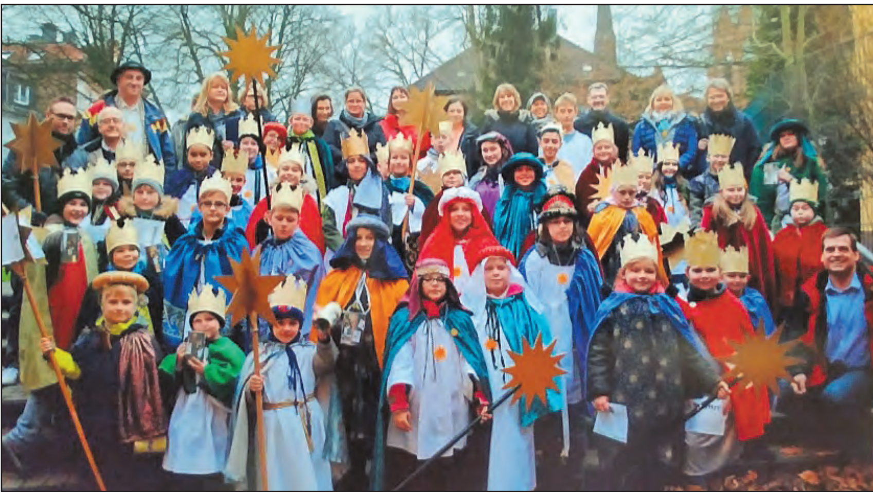
Die kleinen Könige (Caspar, Melchior und Balthasar) aus Katernberg mit ihren Begleitern vor der erfolgreichen Sammelaktion. Foto/Bericht: Matthias Röcken