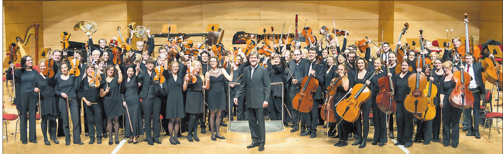
Das Uni-Orchester unter Leitung von Folkwang-Professor Oliver Leo Schmidt, hat sich in 50 Jahren zu einer eindrucksvollen Klangformation mit 90 Musikerinnen und Musikern entwickelt.