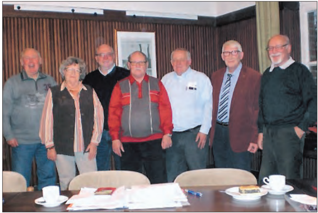
Vorstandsmitglieder nach der Wahl des neuen Vorstandes der AG 60 plus im Rathaus Stoppenberg.