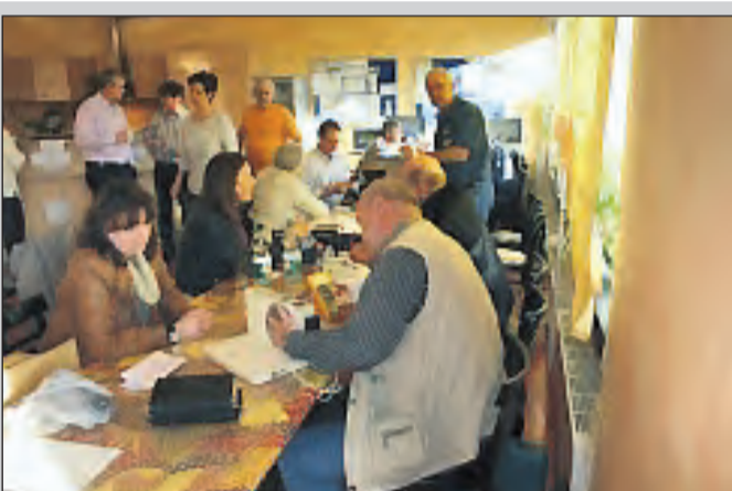
Beim letzten Reparaturcafé wurde fleißig gewerkelt.

15 00 Uhr in der Begegnungsstätte los. Eintritt mit je einem Sekt, Kaffee und Kuchen kostet 6,- Euro.